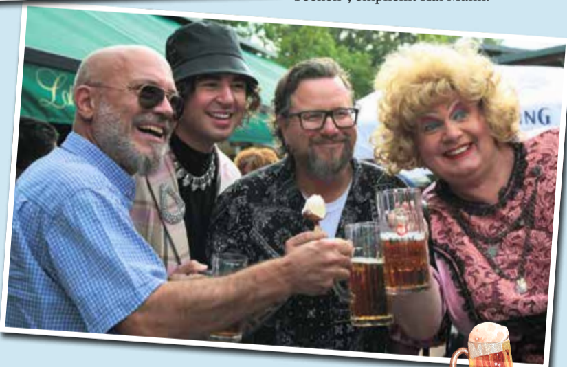
Auch das Comedy-Duo Mundstuhlf aus Frankfurt war als Binding-Botschafter mit auf der Festbierprobe.