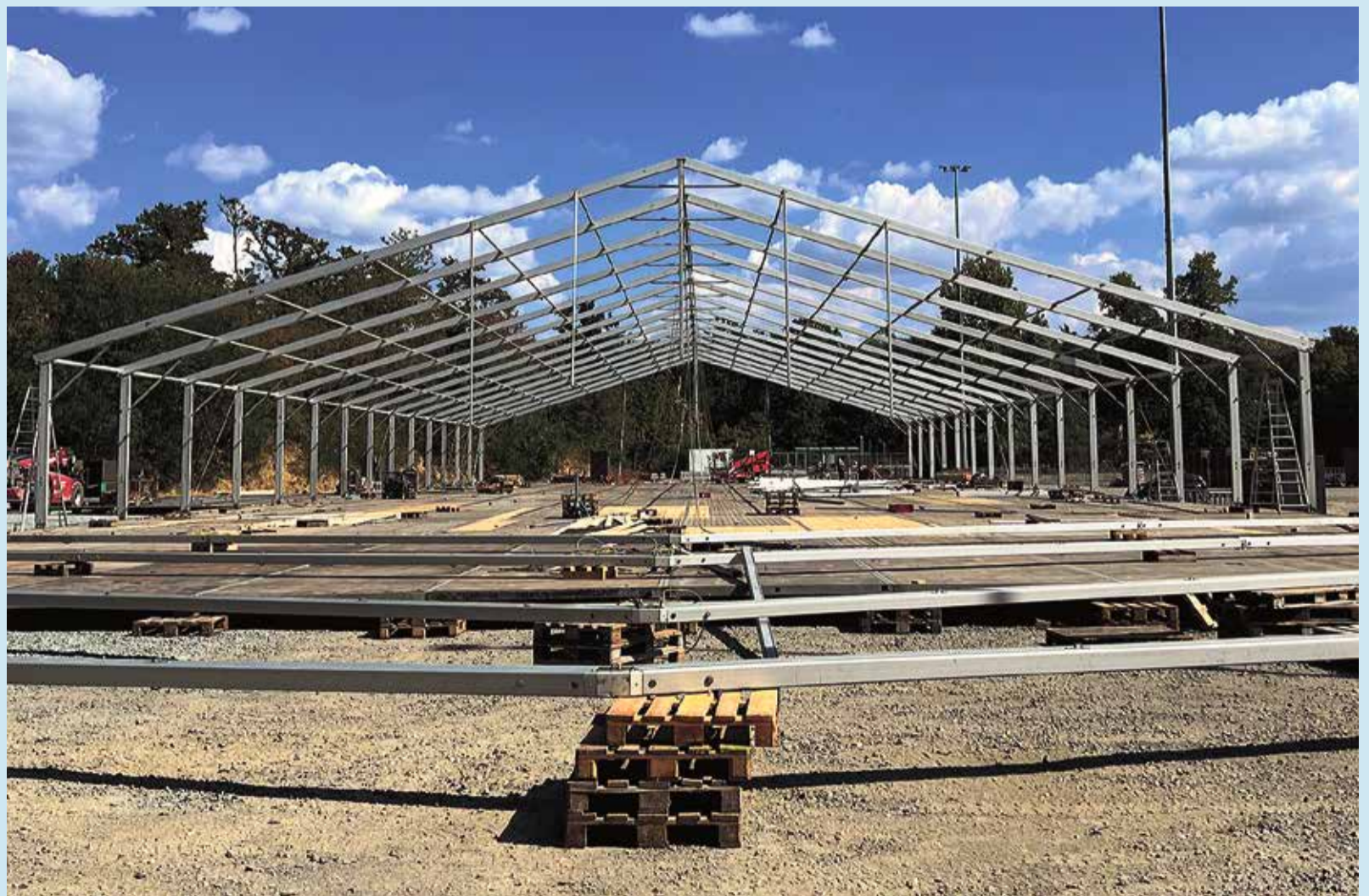
Gut 6.000 Quadratmeter nehmen Festzelt und die angeschlossene Küche auf dem Platz vor dem Deutsche-Bank-Park in Anspruch.