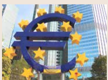
Euro-Symbol am Willy-Brandt-Platz in Frankfurt.

Euro Instandhaltungskosten, die bedingt durch Vandalismus, aber auch wegen Beschädigungen durch das Besteigen des Symbols immer weiter steigen und vom Besitzer, dem Frankfurter Kultur Komitee, nicht mehr aufgebracht werden können. Hinzu kommt, dass durch die Corona-Pandemie zu viele Sponsoren abgesprungen sind. Nun gibt es Überlegungen, das seit über 20 Jahren dort stehende Symbol, abzubauen. Aber noch laufen Gespräche mit der Stadt Frankfurt, der Europäischen Zentralbank, dem Land Hessen und auch mit privaten Investoren. Sollte es zu keiner Einigung kommen, beabsichtigt das Frankfurter Kultur Komitee, das Euro-Zeichen am 15. Oktober 2022 zu versteigern.