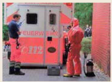
Einsatzübung des Infektions-Rettungswagens am Universitätsklinikum Frankfurt.

versitätsklinikum Frankfurt stellte eine große Herausforderung für alle Beteiligten dar. So muss die Arbeit in den Gebläsenzügen regelmäßig geübt werden, schränken sie doch einerseits die Bewegungsfreiheit ein und beeinflussen andererseits aber auch das Kommunikations- und Konzentrationsvermögen durch die laute Geräuschkulisse im Inneren. Die Bekleidung ist so konzipiert, dass kein Erreger eindringen kann. Auch dem Transportfahrzeug, speziell für solche Einsätze entworfen, kann kein Erreger entkommen. Ebenfalls wichtig: Die Dekontamination, die vollständige Desinfektion. Die Häufigkeit solcher Einsätze mit hochpathogenen Keimen ist glücklicherweise gering.