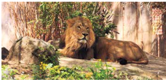
Kiron, der Letzte der Löwendrillinge, ist nach Nürnberg gezogen.