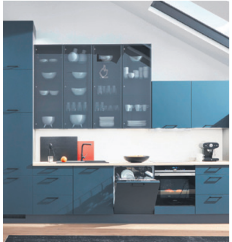
Blau wirkt entspannend. Als Küchenfront ist es gut mit hellen Tönen kombinierbar.