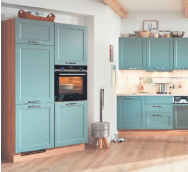
Eine Küchenfront in Schilfgrün holt die Natur in die kulinarische Wirkungsstätte und macht den stressigen Alltag schnell vergessen.