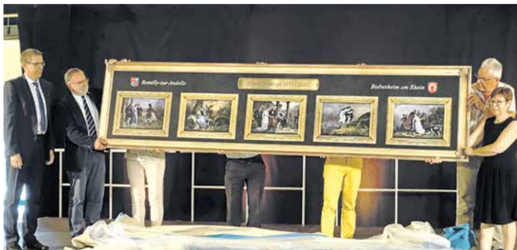
Das Gastgeschenk aus Romilly-sur-Andelle: „La Légende des deux Amants“

Seit 2006 hat er in Biebesheim das Bürgermeisteramt inne, im Jahr zuvor lernte er beim ersten Besuch in Romilly-sur-Andelle seinen damals noch nicht amtierenden Amtskollegen kennen, in seinem persönlichen privaten häuslichen Umfeld. Das war vor 17 Jahren und inzwischen fühle er sich schon ein wenig als Fa-