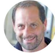
Peter Erbach Autohaus Iser Riedstadt