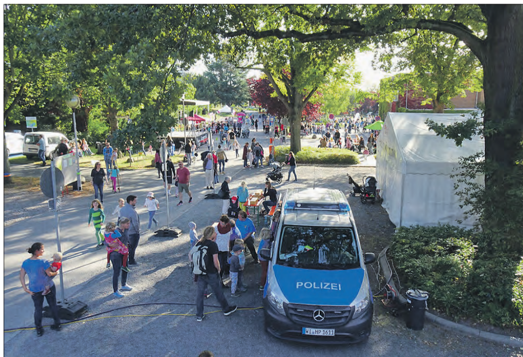
SEIT MEHR ALS ZWANZIG JAHREN wird der Weltkindertag in Seeheim-Jugenheim gefeiert.

Ab circa 15.45 Uhr sind dann die beteiligten Institutionen und Vereine an ihren Infoständen am Start und bieten zusätzlich zu Infomaterial und Gesprächen jede Menge Kreativ- und Bewegungsangebote für alle Altersgruppen an: un-