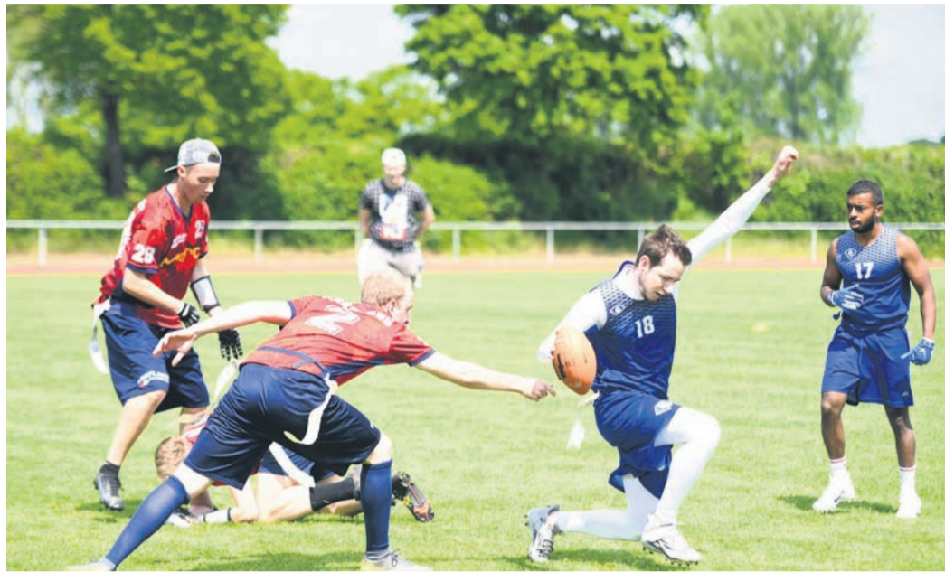
Beim Flag Football stoppt man den Gegner, indem man eine der beiden kleinen Fahnen („Flags“) abzieht. Körperkontakt gibt es im Gegensatz zum American Football kaum. Das Foto stammt aus dem jüngsten Testspiel der Münster Fireflags (rot) gegen die Darmstadt Fun Diamonds (blau) im Gersprenzstadion.

2016 gründete der American Football Verband Deutschland die Deutsche Flag Football Liga. 40 Mannschaften nahmen damals an der Debüttrunde teil, auch die Münster Fireflags. „Das Konzept für die DFFL war im ersten Jahr aber noch unausgereift und die Kosten waren zu hoch“, blickt Rainer Blümmler, Fireflag der ersten Runde und bis heute als Spieler aktiv, zurück. Dennoch nahmen die Münsterer auch 2017 teil, als schon 51 Teams mit von der Partie waren. 2018 und 2019 fehlte