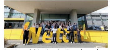
Die Auszubildenden der Zentralverwaltung wurden in der Unternehmenszentrale in Pohlitz begrüßt.

Gedanken haben die Azubi-Ombudspersonen ein offenes Ohr. Engagierten, motivierten Auszubildenden mit sehr guten Leistungen und erfolgreich absolvierter Abschlussprüfung winkt eine Übernahme-garantie bei Netto in einer zukunftssicheren Branche. Und wer aufsteigen möchte, hat bei dem Lebensmittelhändler optimale Karriere-Chancen: Führungspositionen besetzt Netto bevorzugt mit Talenten aus den eigenen Reihen. Mit rund 81.800 Mitarbeitenden und über 5.480 Auszubildenden gehört Netto zu einem der größten Ausbildungsbetriebe im deutschen Einzelhandel.