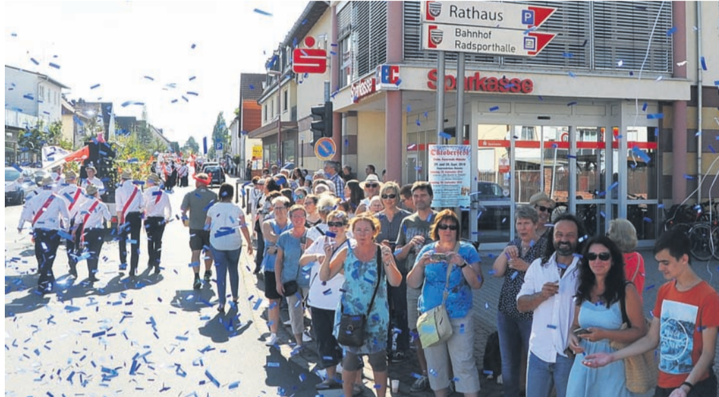
Trotz einiger Sparzwänge und einem Festtag weniger: Der Umzug am Sonntagnachmittag wird in Münster auch diesmal stattfinden und das Publikum unter anderem an die Darmstädter Straße locken, wo dieses Foto entstand.

Hinzu kommen personelle Herausforderungen: „Das ein oder andere Mitglied ist nach den zwei Jahren ohne Kerb nicht mehr dabei.“ Insofern gestaltet es sich für der Verein nun noch schwieriger, von Freitag bis Sonntag die Dienste etwa beim Getränkeausschank zu beset-