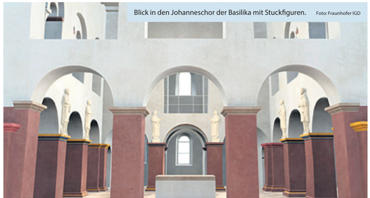
Blick in den Johanneschor der Basilika mit Stuckfiguren.