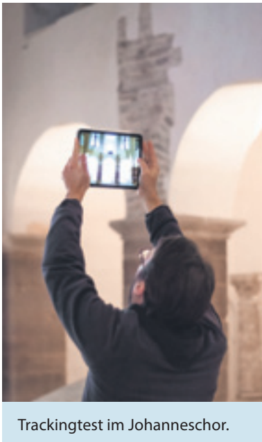
Trackingtest im Johanneschor.