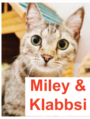
Miley & Klabbsi

Miley und Klabbsi sind erst drei Jahre alt und haben ihr Zuhause wegen eines Umzugs verloren. Nun suchen die beiden Katzen wieder gemeinsam neue Tierfreunde. Das hübsch getigerte Pärchen war bisher nur in der Wohnung, würden aber auch gerne kleine Runden im Garten drehen oder auf einem Balkon in der Sonne liegen. Anfangs zeigen sie sich schüchtern, dann kommen sie aber neugierig zum Streicheln und Spielen. Die unkomplizierten, netten Stubentiger sind kastriert, geimpft, gechipt und sofort auszugsbereit.