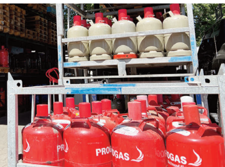
Die Firma Knapp Gase in Michelstadt erwartet keinen Gasmangel bei Flüssiggas. Allerdings könnte es bei Flaschen einen Engpass geben.