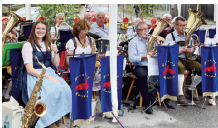
Zweite Halbzeit der musikalischen Saison hat begonnen: Die Breuberg-Musikanten spielten dieses Jahr unter anderem schon zum 25-jährigen Jubiläum des Vereinsrings Rai-Breitenbach auf, begleiteten Frühlingkonzerte im Kursana, Prozessionen und das Altstadtfest in Neustadt. Zu sehen sind sie in der zweiten Jahreshälfte unter anderem beim Kerbumzug Neustadt (6. August, Rai-Breitenbach (2. September) und Ober-Klingen (25. September).