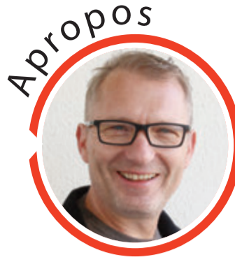
von Volker Zaborowski, Chefredakteur

Fränkisch-Crumbach. Der Reitverein Rodenstein e.V. veranstaltet vom 30. bis 31. Juli sein Sommerreitturnier auf der Reitanlage „Am Lohberg“ in Fränkisch-Crumbach. Am Samstag finden ab 8 Uhr Dressurprüfungen der Klasse A bis M* und Springprüfungen bis zur Klasse S* fortgesetzt. Für Speis und Trank sowie leckeren hausgemachten Kuchen ist bestens gesorgt. red