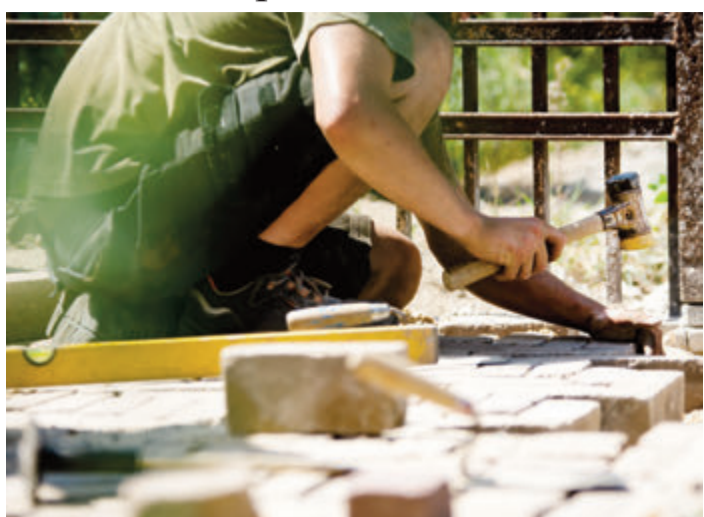
Garten- und Landschaftsbauer im Odenwaldkreis können sich über einen Lohnanstieg von 2,8 Prozent freuen.

Breuberg. Die Stadt Breuberg reicht den Bauantrag für den Feuerwehrhausneubau im Stadtteil Hainstadt ein. In den letzten Monaten fanden zahlreiche Abstimmungen mit unter anderem der örtlichen Wehr statt, so dass die Bauantragsreife erreicht werden und der Bauantrag beim Odenwaldkreis zur Genehmigung vorgelegt werden konnte. Parallel liefen die Untersuchungen und Planungen für die Freimachung des Grundstückes. Fast gleichzeitig ging die Genehmigung des eingereichten Abbruchartrages ein. Seitens der Bauverwaltung wird daher der Abbruch der vorhandenen alten Gebäude und die Vorbereitung des Grundstückes für die neue Bebauung vorangetrieben. Dies ist im Herbst diesen Jahres vorgesehen. Läuft die Genehmigung für den Feuerwehrhausneubau und das darauffolgende Vergabeverfahren für die Rohbauarbeiten des Feuerwehrhauses planmäßig, gehen die Zuständigen von einem rechtzeitigen Baubeginn und Erhalt der Fördermittel aus. Der Baubeginn muss laut Maßgabe der Fristverlängerung bis Dezember 2022 erfolgen. red