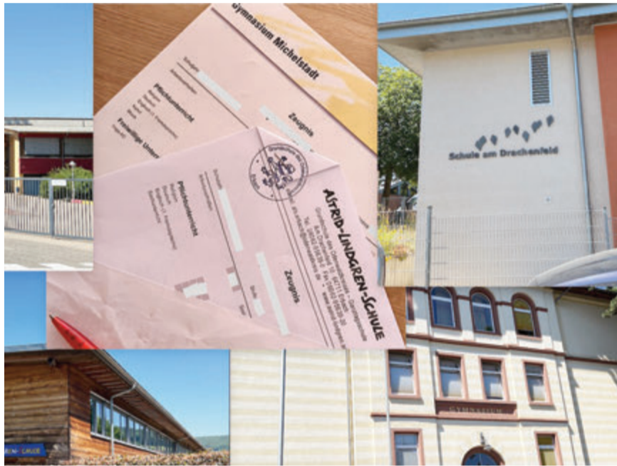
Zentral in der Schule sind die Zeugnisse, nicht immer zur Freude der Schüler und Schülerinnen.

Bundesweit können Schülerinnen und Schüler sich anonym an die Telefonhotline des Vereins „Nummer gegen Kummer“ wenden. Die Beraterinnen