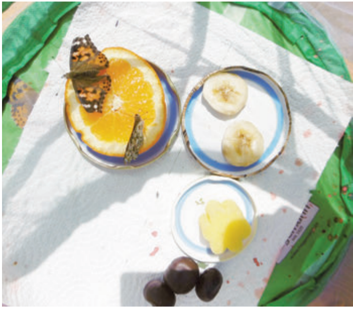
Schmetterlinge laben sich an Fruchtsaft.

Groß-Umstadt. Der Frage, wie der Weg einer Raupe zum Schmetterling ist, waren die Kinder im städtischen Kindergarten