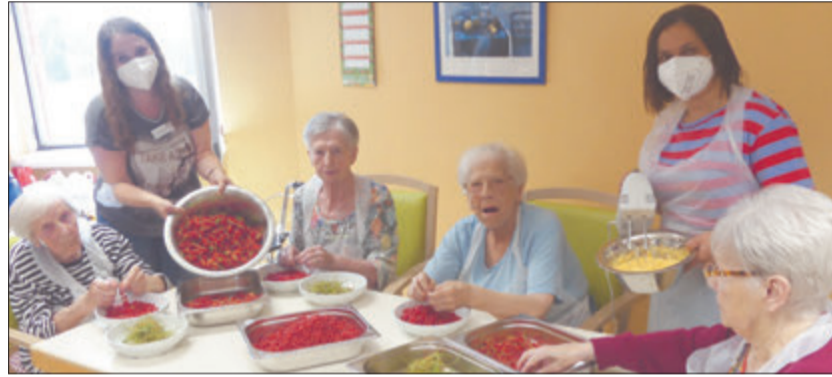
Fleißig bereiten Mitarbeiterinnen und Seniorinnen Hände den Johannisbeermichel vor.

Erbach. Wenn die Koch- und Backgruppe im Alten- und Pflegeheim der Gesundheitszentrum Odenwaldkreis GmbH (GZO) bei ihren regelmäßigen Treffen ein jahreszeitlich passendes Gericht zubereitet, kommt das Ergebnis meist der gesamten Bewohnerschaft zu Gute. Ende Juni galt es, die in den Tagen zuvor im Wohnergarten selbst geernteten Johannisbeeren zu verarbeiten. Dass das Abzupfen der einzelnen Beeren von den Rispen eine gewisse Fingerfertigkeit erfordert und die Feinmotorik fördert, ist ein positiver Nebeneffekt.