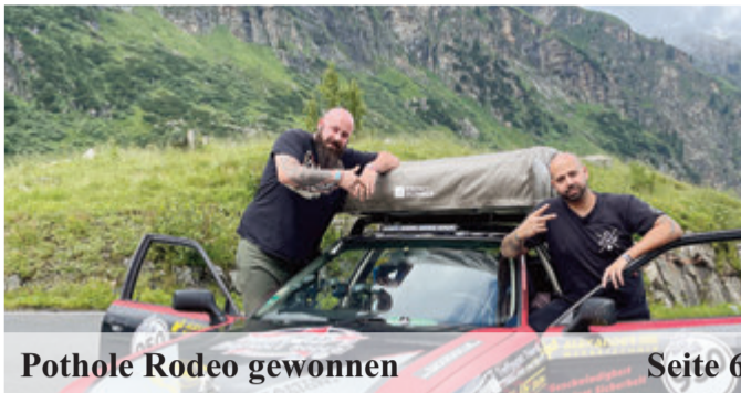
Pothole Rodeo gewonnen