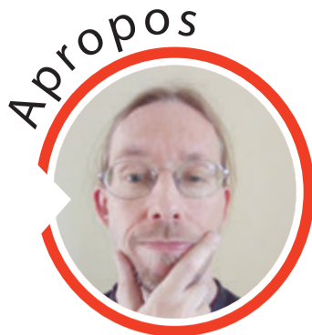
von Sven Iwertowski, Redaktionsleiter

Erbach. Rund 150 interessierte Jugendlichen „Brich Dein Schweigen – Hinter jedem Mißbrauch steckt ein Gesicht“ bildete die Veranstaltung den Auftakt für weitere Veranstaltungen im Odenwaldkreis. Der Dokumentarfilm erzählt von drei Schauspielerinnen, die sich im Netz als 12-Jährige ausgeben, und folgt ihnen vom ersten Kontakt bis zu den ersten Treffen. Zum Abschluss nutzten die Besucher die Informationsstände. red