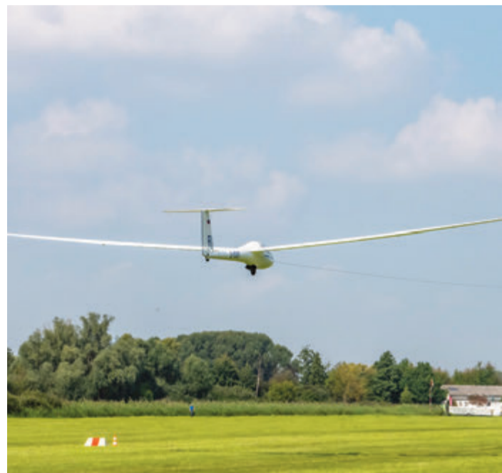
Ein Segelflieger hebt ab.

Reinheim. Der Sommerleseclub der Stadtbücherei Reinheim ist bis zum 22. September geöffnet. Teilnehmer mit einer Clubkarte können gelesene Bücher mit einem Bewertungsbogen bewerten und erhalten dafür ein „Krönchen“ auf der Clubkarte. Für jede komplett ausgefüllte Clubkarte ist eine Überraschung geplant. Dank Unterstützung der Hessischen Leseförderung konnten für den Sommerleseclub neue Bücher für den Medienbestand der Stadtbücherei gekauft werden. Informationen zum Sommerleseclub auf der Homepage der Stadtbücherei www.reinheim.de/buecherei/kinder-und-jugendbuecherei/sommerleseclub . red