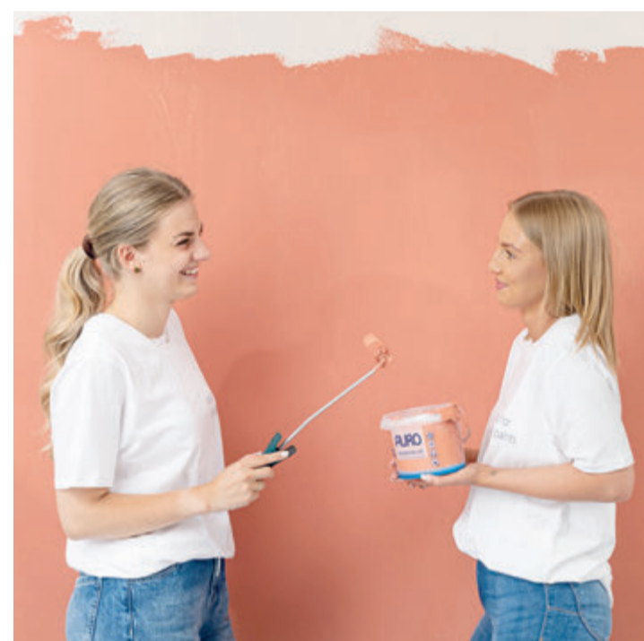
Auch für Frauen ein durchaus attraktiver Job: Malerinnen, Lackiererinnen, Anstreicherinnen.

Das Handwerk der Maler und Lackierer ist ein vielschichtiges und vielfältiges Tätigkeitsfeld, bei dem es mittlerweile um viel mehr geht als nur um das „Schwingen des Pinsels“ – damit ist schon fast sicher, dass kein Tag auf der Arbeit langweilig wird. Zunächst Grundsätzliches: Der Aufgabenbereich umfasst ganz grob das Gestalten, Pflegen und Restaurieren von Oberflächen im Außen- und Innenbereich. Tapeten auftragen und streichen, Wandmalereien auffrischen und schützen oder das Beschichten von Oberflächen, das ist das Metier dieses Handwerks.