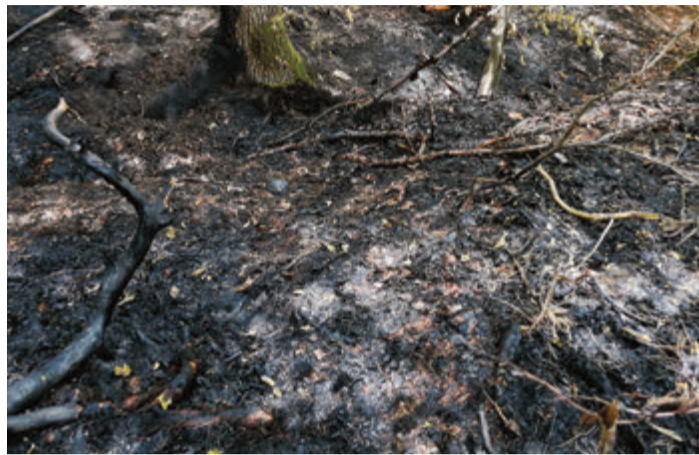
Feuer wie diese können, wenn sie unbeobachtet sind, leicht zu großen Bränden werden.

Südhessen. Das Hessische Umweltministerium hat die erste von zwei Alarmstufen, Alarmstufe A, für die Forstverwaltung in Hessen ausgerufen. Die Aussicht auf ein Anhalten der Wetterlage ohne ergebige landesweite Niederschläge macht diesen vorsorgenden Schritt erforderlich. Für die nächsten Tage besteht nach aktuellen Prognosedaten des Deutschen Wetterdienstes (DWD) in Hessen überwiegend hohe Waldbrandgefahr. Weite Teile Hessens sind seit Wochen ohne größere Niederschläge geblieben. Nach unterdurchschnittlichen Niederschlägen in den Monaten März, Mai und Juni setzte sich dieser Trend auch im Juli bislang fort. Bedingt durch das Andauern der trockenen Witterung bei gleichzeitig hohen Temperaturen verschärft sich die Waldbrandgefahr in ganz Hessen. Durch die aktuelle Witterung sind die Oberböden im Wald weitestgehend ausgetrocknet. Das inzwischen