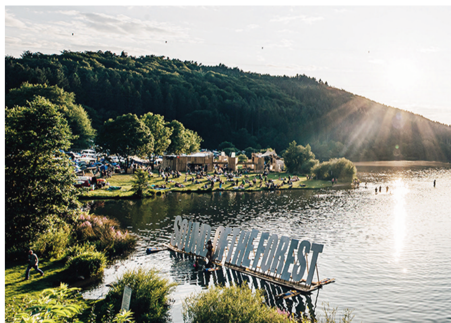
Vier Tage See, Musik und möglicherweise Sonnenuntergänge wie diesen hier.

Headliner sind „Faber“ und die „Giant Rooks“. Ersterer setzt sich mit Rotweinglas, Gitarre und Zigarette mit der wider-