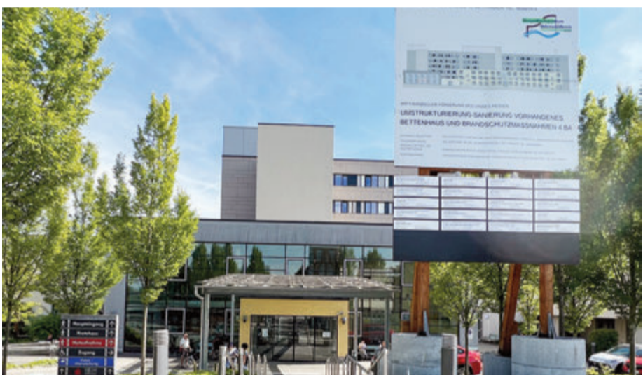
Die Möglichkeit besteht, dass coronapositiv getestete Mitarbeiter weiterarbeiten; dann aber nach Bedarfsprüfung und unter Auflagen.