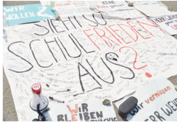
Die Proteste waren erfolgreich. An der Ernst-Göbel-Schule kehrt wieder Frieden ein.