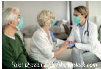
NPD-HEXKADVR:220061 August 2022

Vereinbaren Sie am besten gleich einen Vorsorgetermin bei Ihrer Ärztin oder Ihrem Arzt, um optimal auf den Herbst vorbereitet zu sein. Weitere Informationen finden Sie unter www.impfen.de/guertelrose