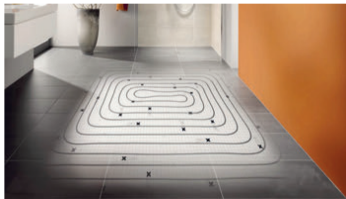
Fußbodenheizungen können nicht nur Wärme zuführen, sondern auch abtransportieren.

Über die Heizflächen kann dem Raum nicht nur Wärme zugeführt, sondern auch entzogen werden. Dafür fließt kaltes Wasser durch die Leitungen der Fußboden- oder Wandheizung. Entsprechend temperiert wird es von einer Wärmepumpe. So sorgt das System für