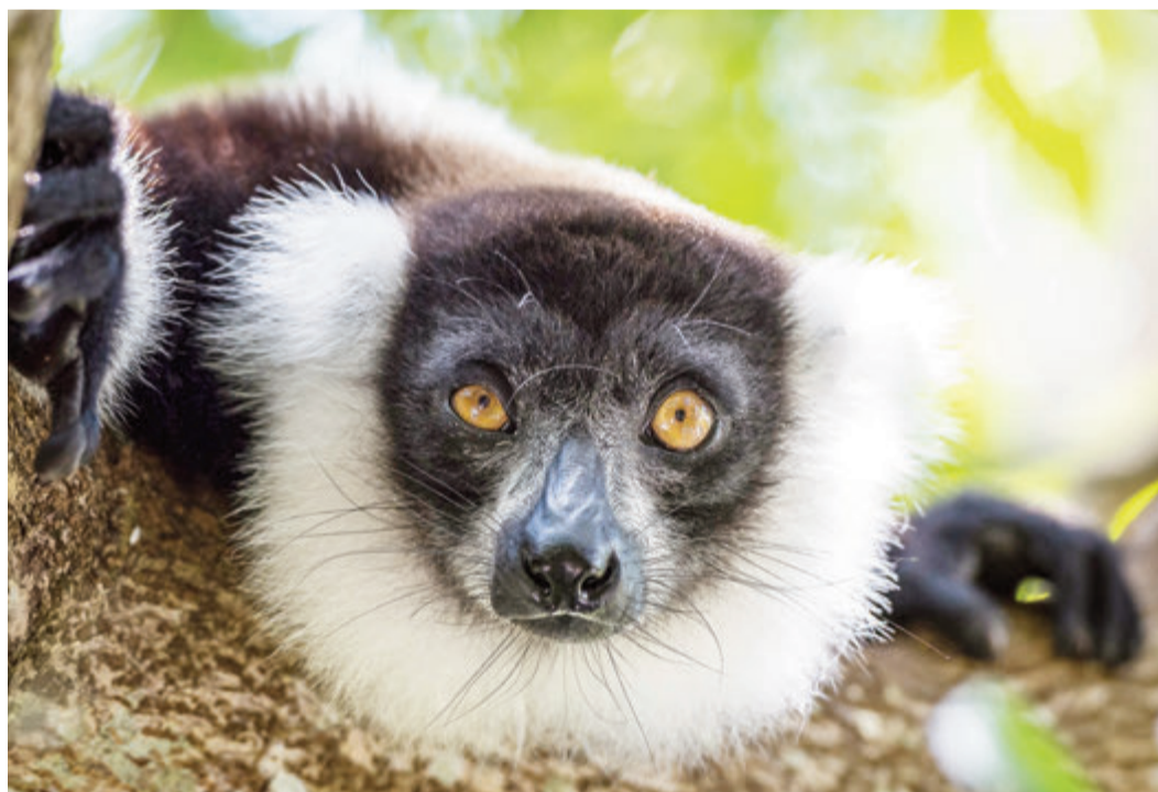
Lemur: Mit diesem Blick gewinnt man Freunde und Freundinnen.