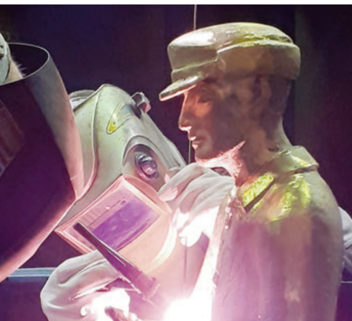
Die letzten Arbeitsschritte sind getan.