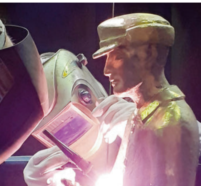
Die letzten Arbeitsschritte sind getan.