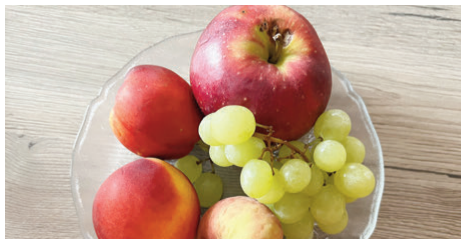
Wer vor dem Urlaub noch Lebensmittel retten möchte, statt diese in die Tonne zu werfen, kann die Lebensmittel auch über Foodsharing mit anderen teilen.

Odenwaldkreis. Im Jahr 2020 wurden in Deutschland fast 6,5 Millionen Tonnen Lebensmittel in privaten Haushalten weggeworfen. (Quelle: Bundesministerium für Ernährung und Wirtschaft; Stand 01.07.2022) Es gibt viele Organisationen, die sich Lebensmittelrettung zum Ziel gesetzt haben. „Zu gut für die Tonne“ gibt Verbrauchern nützliche Tipps, wie man das Wegwerfen von Lebensmitteln vermeiden kann und bietet beispielsweise Rezepte für die Resteverwertung an. Die rund 960 Tafeln in Deutschland hingegen sind für die Verteilung von Lebensmitteln an Bedürftige verantwortlich. Lebensmittel zu retten fällt in den Aufgabenbereich der Organisation Foodsharing. Hier sollen Privatpersonen, Produzenten und Händler auf einfachem Wege miteinander vernetzt werden, um nicht mehr benötigte Lebensmittel auszutauschen. „Wir holen auch nur in Geschäften Lebensmittel ab, bei denen die Tafel nichts holt. Die Tafel hat immer Vorrang“, erklärt Anja Grünwald von Foodsharing Darmstadt auf Nachfrage. Die überschüssigen Lebensmittel