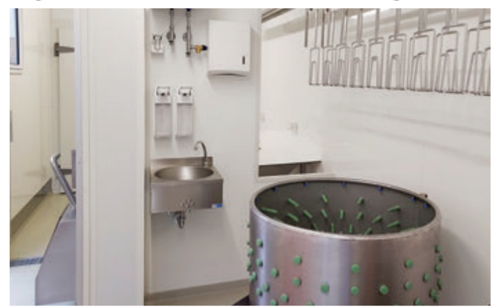
Einblick in den mobilen Schlachtbetrieb.

Odenwaldkreis. Ein Biobetrieb im Odenwaldkreis hat die bundesweit erste EU-Zulassung vom Regierungspräsidium Darmstadt für eine mobile Geflügelschlachanlage erhalten. Mit diesem Konzept sollen lange, leidvolle Transporte vermieden werden. Entscheidend ist die EU-Zulassung der Anlage, denn sie ermöglicht es landwirtschaftlichen Betrieben, das Fleisch nicht nur direkt zu verkaufen, sondern es auch in Verarbeitungsbetriebe zu bringen, es zu Produkten wie Geflügelwurst oder Geflügelbolognese verarbeiten zu lassen und so besser zu vermarkten. Im Dezember 2021 hatte Hessen dafür die Voraussetzungen geschaffen und in einem Erlass geregelt, unter welchen Voraussetzungen eine mobile Geflügelschlachanlage auch in einem größeren Umfang und nach EU-Hygienestandard betrieben werden kann. Damit betritt Hessen Neuland und startet ein Pilotprojekt. Die Anlage, die nun zugelassen wurde, ist acht Meter lang, hat einen integrierten Kühlraum und