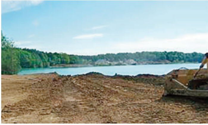
Auch wenn es ungefährlich aussieht: An Baggerseen sollte man mit Vor- und Umsicht baden.

Odenwaldkreis. Fast ein Dutzend Menschen sind in Hessen in diesem Jahr schon ertrunken. Neben großen Fließgewässern wie Main und Rhein sind auch Seen ein häufiger Unfallort. Angesichts dessen warnt die Bergaufsicht beim Regierungspräsidium Darmstadt insbesondere vor Gefahren, die in den zahlreichen Baggerseen lauern.