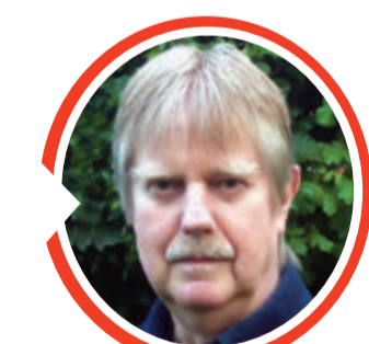
von Dr. Detlef Eichberg