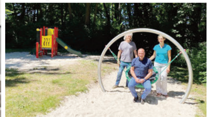
Zwei neue Spielgeräte warten auf fröhliche Kinder.