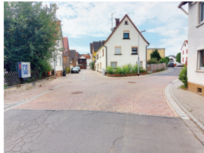
Die Hofgasse in neuem Glanz.