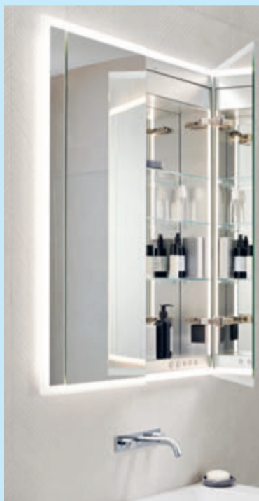
Komplett wird der Waschtisch erspiegelt.

(akz-o) Schon in der Barock-Zeit nutzten Architekten Spiegel, um Räume größer wirken zu lassen. In Form moderner Spiegelschränke sind sie heute gerade für kleine Badezimmer ein absolutes Must-have, denn sie bieten alles in einem: durchdachten Stauraum in attraktivem Design, Zusatzfunktionen wie Steckdosen und smarte Lichttechniken. Eine gute Beleuchtung spielt bei der Raumwahrnehmung eine zentrale Rolle und ist ein echter Wohlfühlfaktor. So bieten viele Spiegelschränke mittlerweile integrierte Beleuchtungssysteme, die die Nutzer, das Spiegellinnere und den Waschtisch bis hin zum ganzen Raum perfekt beleuchten können. Manche smarten Spiegelschränke verfügen zudem über Programmfunktionen, die das Lichtfarbspektrum automatisch und tagszeitspezifisch auf die Bedürfnisse der Nutzer anpassen. Damit werden ganz neuartige Lichteindrücke im Badezimmer möglich. Bei Neubau oder Renovation können auch einbaufähige Modellvarianten des Spiegelschranks gewählt werden. Damit verschwindet der Schrank vollends in der Wandfläche, ohne dass dabei die Stimmung leidet.