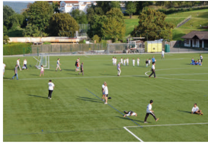
Vielfältige Aktivitäten auch im Alltag.

spielt in der zweiten Runde des DFB-Pokals gegen die Stuttgarter Kickers . Die Schwaben spielen derzeit in der Oberliga Baden-Württemberg und kegelten in der ersten Pokalrunde die Spielvereinigung Greuther Fürth aus dem Wettbewerb. Anpfiff ist am 18. oder 19. Oktober. Keine großen Sprünge plant Eintracht-Sportvorstand Markus Krösche . Eine bodenständige Personalplanung unter Berücksichtigung traditioneller kaufmännischer Tugenden kündigt Krösche an. Trotz der Champions League Teilnahme und der zu erwartenden zusätzlichen Einnahmen setzt Krösche auf Kontinuität und nicht auf kurzfristige Effekte. Das sagte er der Frankfurter Rundschau. (vz) Heute ist die SG mit knapp 1.000 Mitgliedern einer der größten Sportvereine des Odenwaldkreises mit den vier Abteilungen Leichtathletik und Turnen inklusive Lauftreff, Fußball, Tischtennis sowie Badminton. Zum Angebot gehört auch das Sportzentrum der SG mit dem Kunstrasenplatz, der für Fußball, aber im Sommer auch für Gymnastik, Zumba und Kleinkinder-Sport genutzt wird. Der Naturrasenplatz mit Aschenbahn, Sprunggrube und der Hochsprungeinrichtung ist fester Bestandteil des Fußballprogramms und der Leichtathletik. Eine Minute Fußweg vom Vereinsheim entfernt ist die ebenfalls für die Sportangebote der SG genutzte Heinrich-Böhm-Halle. Dort werden Tischtennis, Jugendfußball im Winter, Kinderturnen, Wettkampfgymnastik, Fitness, Zumba und weitere trainiert. red