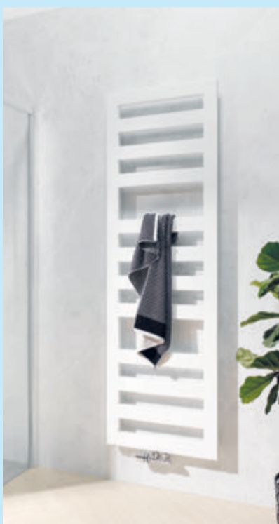
Das Aufwärmen der Handtücher ist mit dem Designheizkörper problemlos möglich.

Seine superflache Form und klaren Linien machen den Heizkörper zum eleganten Hingucker im Badezimmer. Dabei spendet er nicht nur behagliche Wärme, sondern bietet auch ausrei-