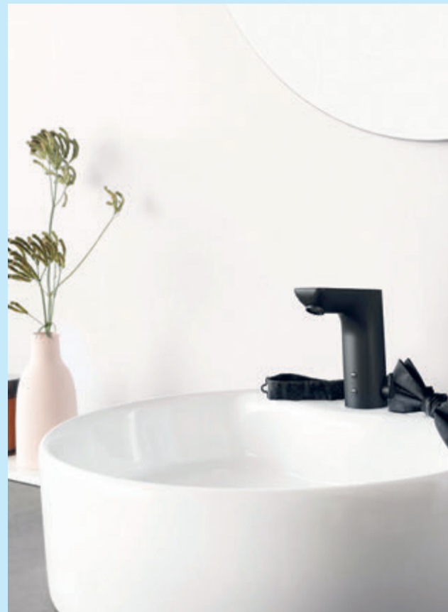
Ein großer, mattschwarzer Wasserhahn.

(akz-o) Zeitlos, edel und exklusiv – Schwarz als neue qualitativ hochwertige Trendfarbe ist in Sachen Einrichtung so beliebt wie nie. Das Armaturensortiment wurde um eine neue Schwarzfarbe erweitert, die nicht nur optisch, sondern auch haptisch als Must-have für den Sanitärbereich gilt. So sorgt die neue Edition vor allem mit der Kombination aus Oberfläche und dem edlen Farbton Mattschwarz für ein Erlebnis der Extraklasse. Mit diesem matten Schwarz wird die perfekte Verbindung von Praktikabilität, Funktionalität und designstarker Optik geschaffen und ist perfekt für urbane Badezimmer im trendigen Mix-and-Match-Stil. Zeitlos und vielseitig erzeugt Schwarz in Kombination mit anderen Farben ansprechende Kontraste und bringt einen authentischen, hochwertigen Stil in Bad und Küche.