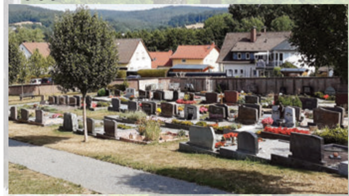
Durchgehende Wiesenflächen für Sargbestattungen.

dafür, um nicht zu viel Aufwand zu machen und im Tode ruhig und unauffällig zu sein. Manchmal spielt auch der Kostenfaktor eine Rolle. Die Pflege der Grabstätten erfolgt hierbei durch die Stadt, so dass eine Bepflanzung der Grabstätte durch die Angehörigen entfällt. Eine auf Fundamenten verlegte Schriftplatte ist dabei als Grabmal vorgesehen. Die Wiesengrab-Bestattung erlaubt nur Sargbestattungen, auf Antrag können Ehepaare oder Lebensgemeinschaften nebeneinander bestattet werden. Die Ruhefrist beträgt 30 Jahre ohne Verlängerungsoption. Die Kosten für ein Wiesengrabfeld belaufen sich auf 1.860 Euro. Weitere Informationen erhalten Interessierte über das Friedhofsamt im Stadthaus unter Tel.: 06061-74114-142. red