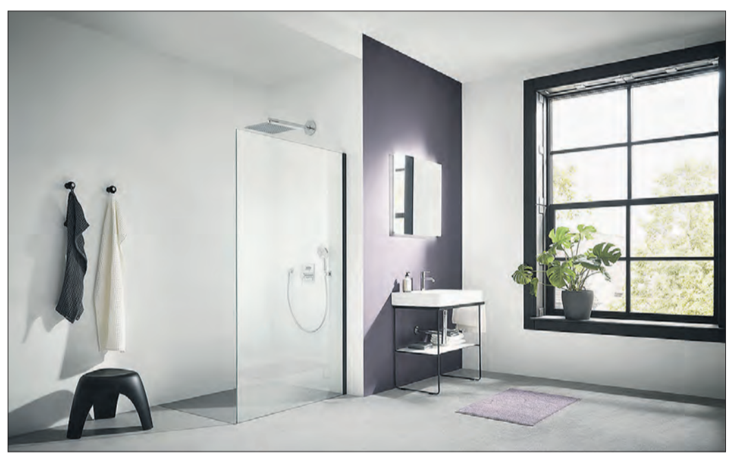
Auch in der Version Schwarz Soft bedeutet die WALK-IN XC Duschkabine Freiheit pur.

Wer Fan von klaren und eleganten Linien ist, der ist mit der WALK-IN XB von Kermi richtig beraten. Hinter der Dusche mit reduziertem Profildesign steckt ein ausgeklügeltes System mit vielen Möglichkeiten. Sie ist als geteilte Konzeption mit Festfeld erhältlich, die sich dadurch ganz leicht transportieren lässt. Das Festfeld lässt sich wahlweise mit Spiegelglas ausstatten, wodurch auf sehr einfache Weise ein Ganzkörperspiegel im Bad integriert werden kann. Mit Akzenten in Schwarz Soft wird die