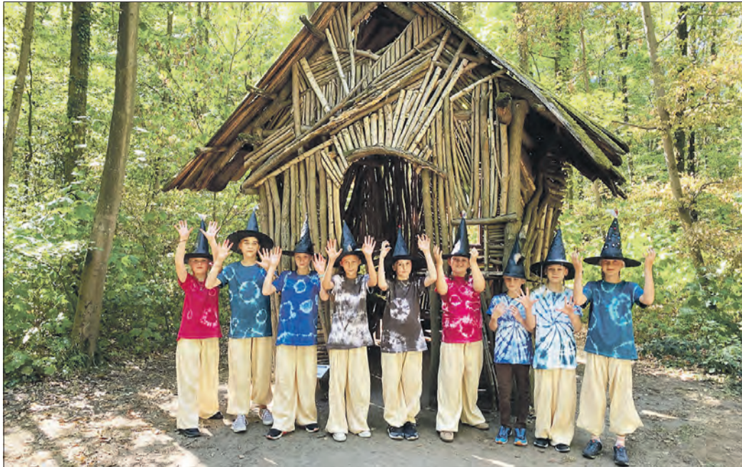
KLEINE HEXEN vor dem Hexenhaus.

Kindertheater auf dem Internationalen Waldkunstpfad