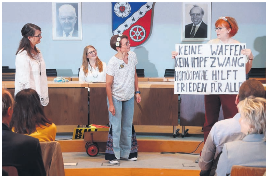
Protest im Parlament.