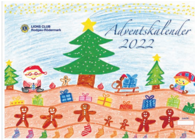
Kalenderansicht des letzten Jahres.

Rodgau (RZ) Die Herbstferienspiele des JSK Rodgau finden vom 24. bis 28. Oktober statt. Die Anmeldungen sind auf der JSK-Website zu finden, und können in der Geschäftsstelle im Ostring 18 abgegeben oder per E-Mail ( ferienspiele@jsk-rodgau.de ) geschickt werden. Unter dieser E-Mail Adresse werden auch Fragen geklärt