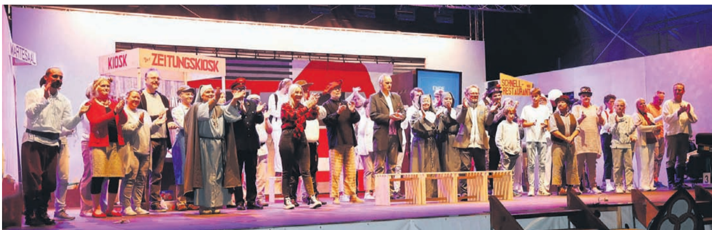
Das Finale: Gelungene Jubiläumsaufführung des Großen Welttheaters.

Unabhängiges Wochenblatt · Amtsverordnungsblatt der Stadt Rodgau