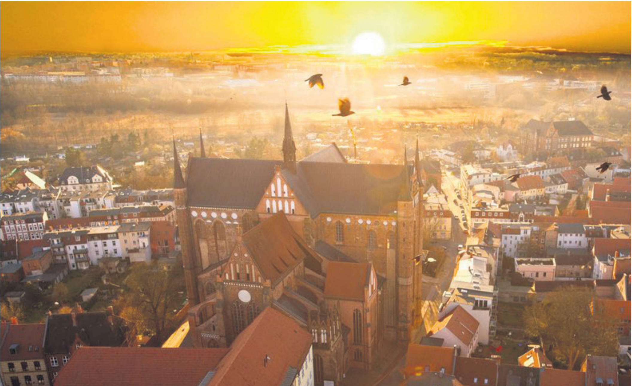
Blick auf Wismar: Seit 20 Jahren gehört die historische Altstadt mit ihren monumentalen Backsteinkirchen und repräsentativen Kaufmannshäusern zum Welterbe der UNESCO.