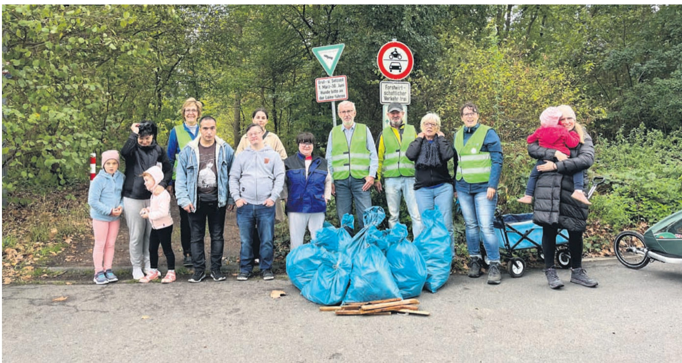
Die Helferinne und Helfer mit ihrer Ausbeute.

lichen das Abtauchen im Mikrokosmos Wald und führen zur Entspannung. Die Teilnahme kostet zehn Euro. Treffpunkt ist am Parkplatz am Friedhof Schwarzbachstraße. Der Kurs findet auch bei Regen statt. Weitere Informationen finden Interessierte im Internet unter www.vhs-obertshausen.de . Offene Fragen – auch zur Anmeldung – beantwortet das Team der Volkshochschule unter Telefon: 7034114 oder per E-Mail: vhs@obertshausen.de .