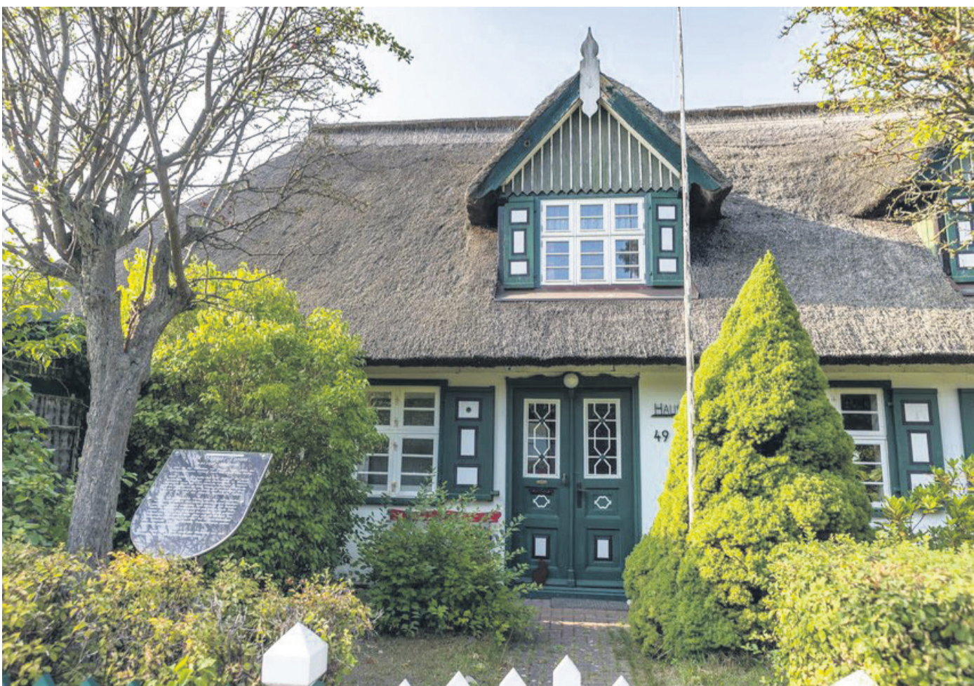
Graal-Müritz ist eines der schönsten Ostseeheilbäder Mecklenburg-Vorpommerns.

küste haben so viele Schriftsteller Ruhe, Muße und Inspiration gefunden. Franz Kafka etwa lernte dort seine letzte große Liebe kennen, Erich Kästner verbrachte in Müritz den letzten unbeschwertesten Sommerurlaub seiner Jugend und Walter Kempowski verdankt das Kennenlernen seiner Eltern der unvergleichlichen Stimmung auf der Graaler Seebrücke. Wer möchte, kann den bedeutsamen Schriftstellern auf ihren Spuren durch Graal-Müritz folgen. Hinweisschilder im Ort weisen den Weg.