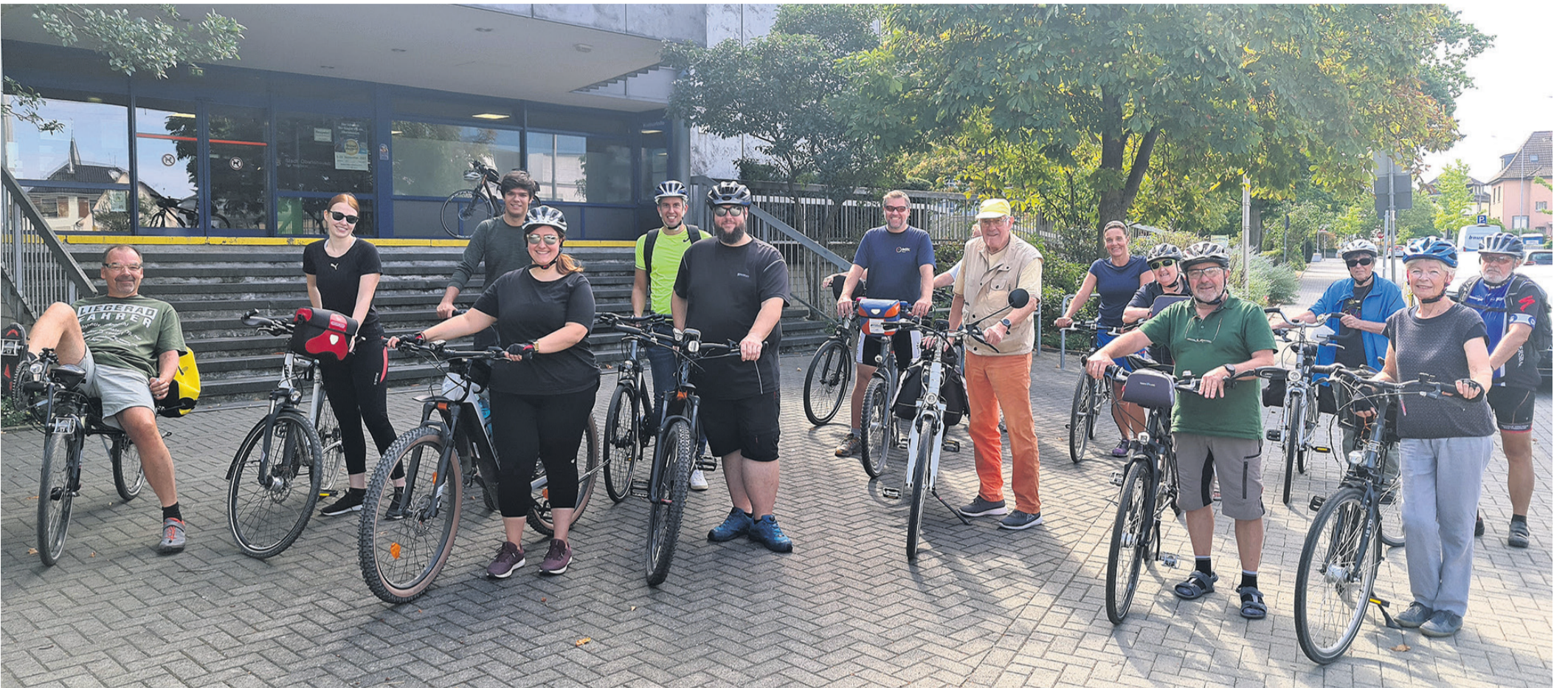
Drei angebotene Touren gehören zum jährlichen Stadtradeln in Obertshausen dazu. Hier sind die Teilnehmerinnen und Teilnehmer der Auftakt-Tour zu sehen. Am 23. September gibt es noch eine Abschluss-Tour.

Unabhängige Wochenzeitung und Nachrichten aus und für Obertshausen