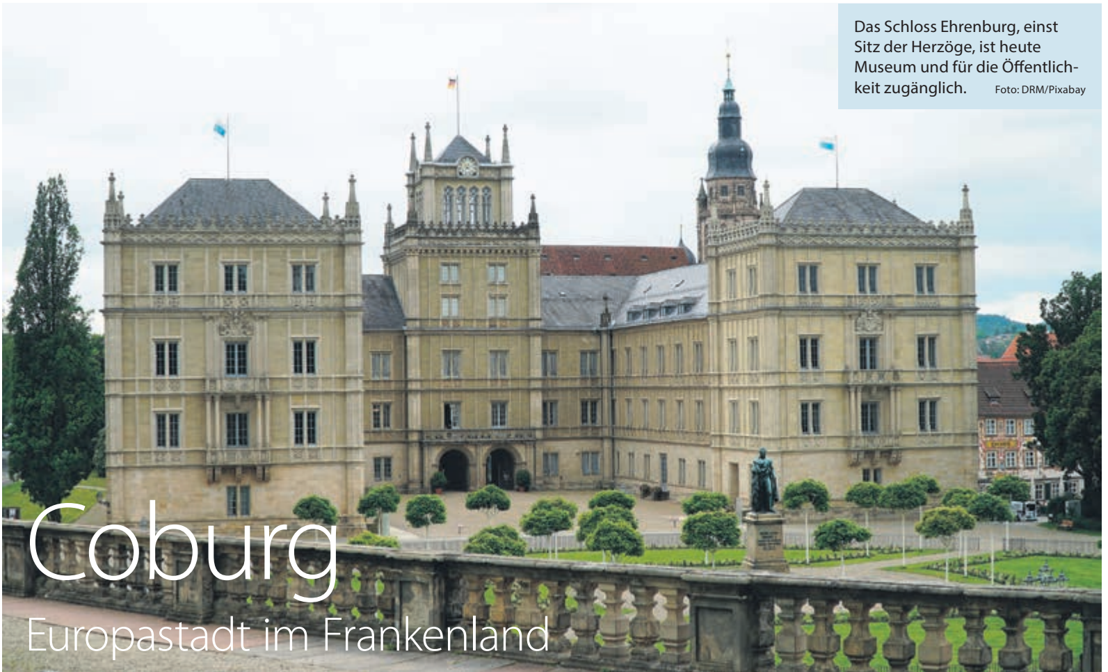
Das Schloss Ehrenburg, einst Sitz der Herzöge, ist heute Museum und für die Öffentlichkeit zugänglich.