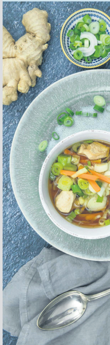
Die asiatische Hühnersuppe mit Ingwer ist ein wahrer Immunbooster.