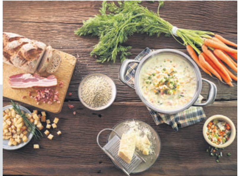
Eine abwechslungs- und vitaminreiche Ernährung ist im Winter besonders wichtig, um unsere körpereigenen Abwehrkräfte zu stärken.

Lasagne in Stücke schneiden, mit einem Spatel herausheben und anrichten. Tipp: Dazu passt eine Joghurtsauce mit Dill.