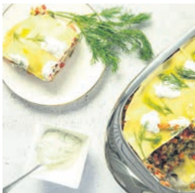
Die kalte Lachslasagne schmeckt nicht nur an warmen Sommertagen.

Ob ein Nudel-Zucchini-Salat mit Feta-Dressing, Asia-Gemüse mit Tofu und Cashewkernen oder One-Pot-Pasta mit Orecchiette und Hähnchen: Es gibt viele unkomplizierte Gerichte, die mit dem richtigen Kochgeschirr besonders vitaminschonend und kaloriensparend zubereitet werden können. In den hochwertigen Edelstahl-Pfannen und Töpfen von AMC etwa lässt sich Fleisch ohne Zusatz von Fett oder Öl braten, Gemüse kann schonend ohne Zugabe von Wasser gegart werden. So bleiben das volle Aroma sowie Vitamine und Mineralstoffe erhalten. Temperaturmesser und Temperaturanzeiger im Deckel sorgen dafür, dass alles bei optimaler Hitze zubereitet wird. Köstliche Rezepte wie auch diese kalte Lachslasagne gibt es unter www.kochenmitamc.info .