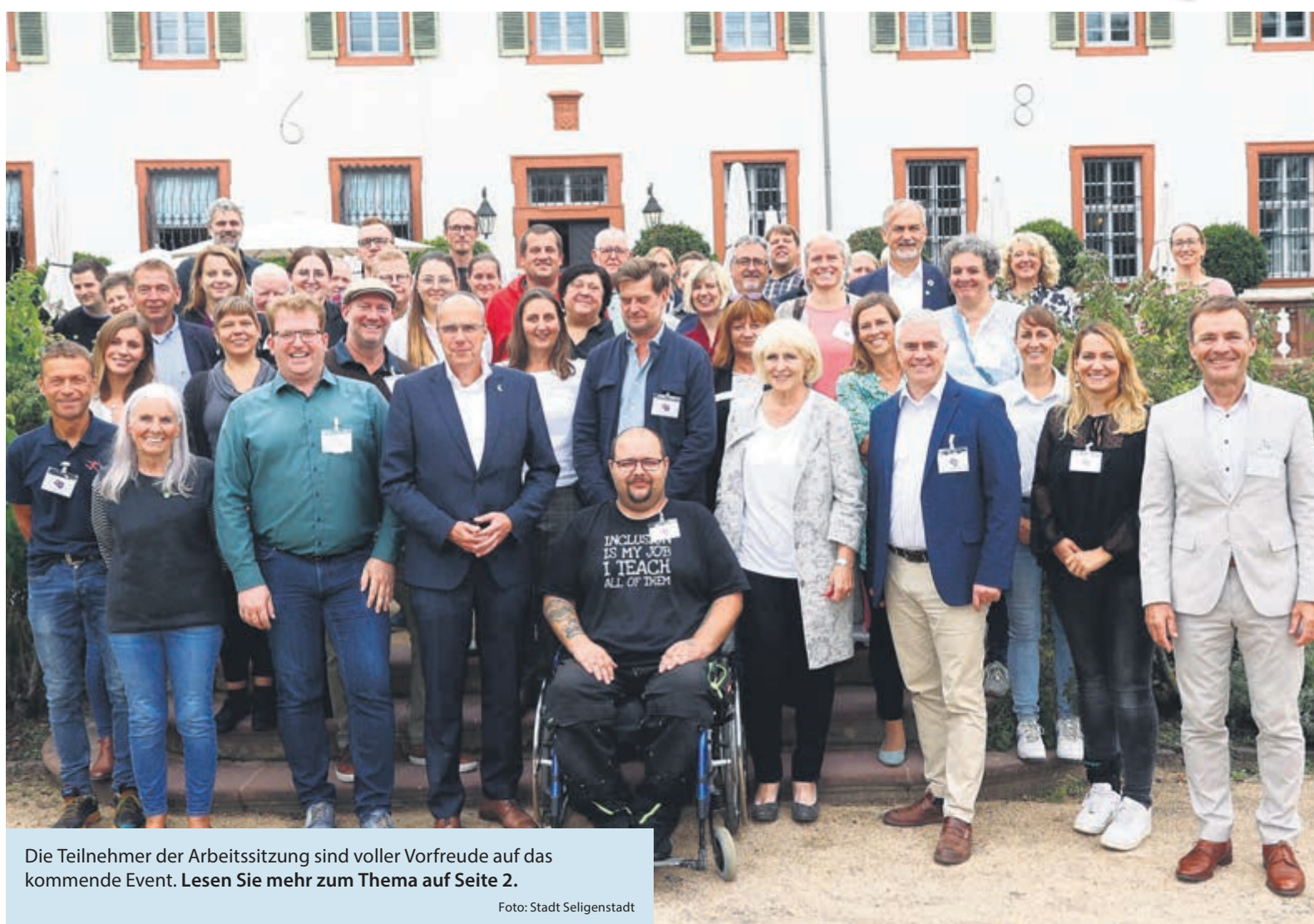
Die Teilnehmer der Arbeitssitzung sind voller Vorfreude auf das kommende Event. Lesen Sie mehr zum Thema auf Seite 2.