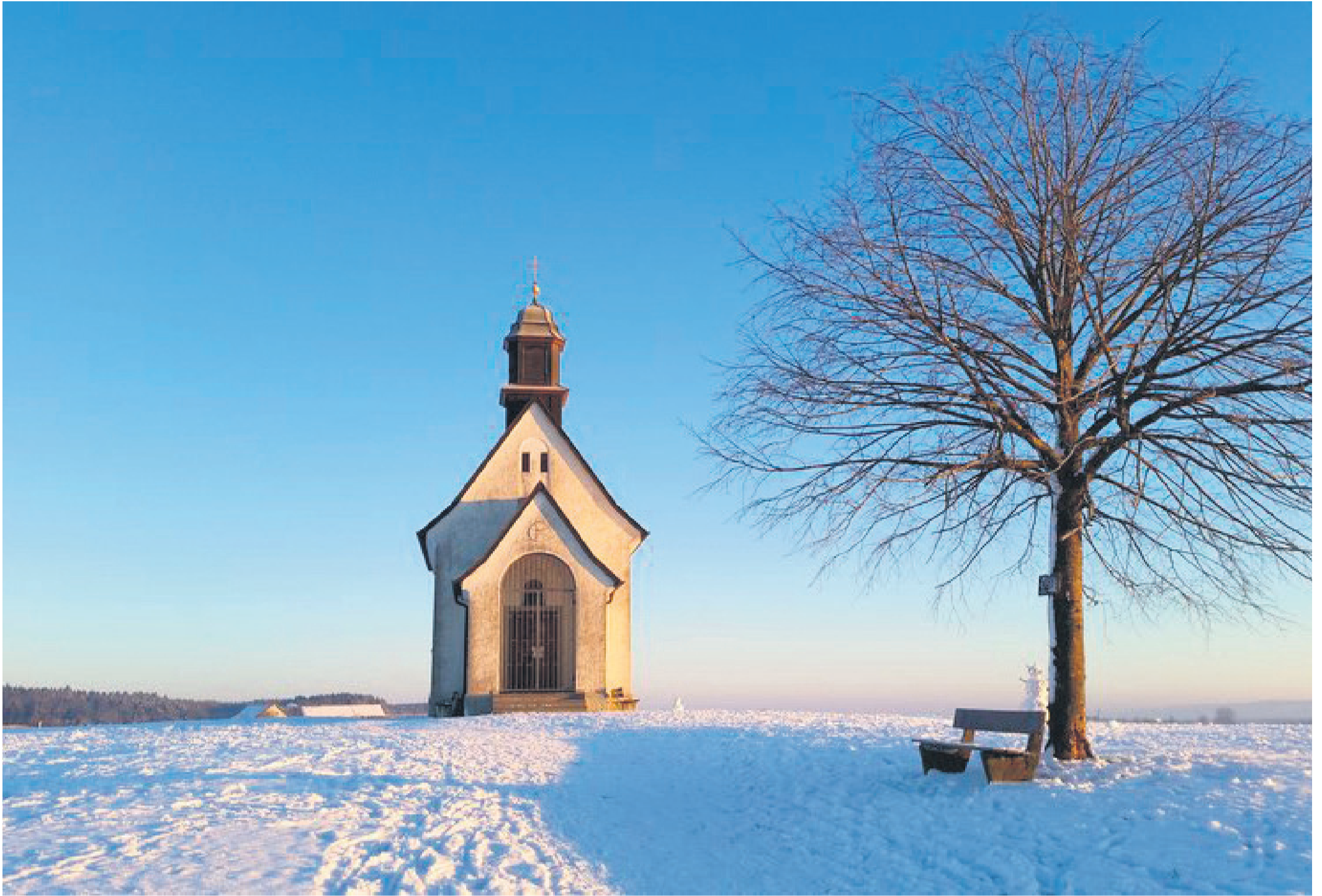
Die verschneite Landschaft rund um den Bodensee lädt zu Winterwanderungen ein.