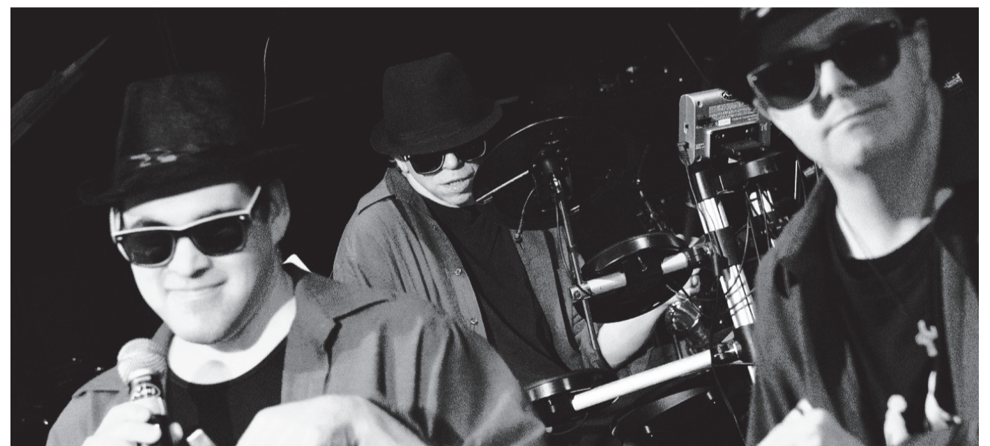
Die Irren Typen sind bereit für das große Konzert im Saal des Bürgerhauses Hausen am 9. Oktober.

chen und kostenlosen Einlass. Karten sind direkt an der Tageskasse erhältlich. Also einfach vorbeikommen – zwei Stunden voller Lust und Leidenschaft sind garantiert! Informationen zum Konzert und zum Unterrichtsangebot der Musikschule Obertshausen gibt das Team des Musikschulbüros gerne unter Telefon 06104 7034222 oder per E-Mail: musikschule@obertshausen.de.