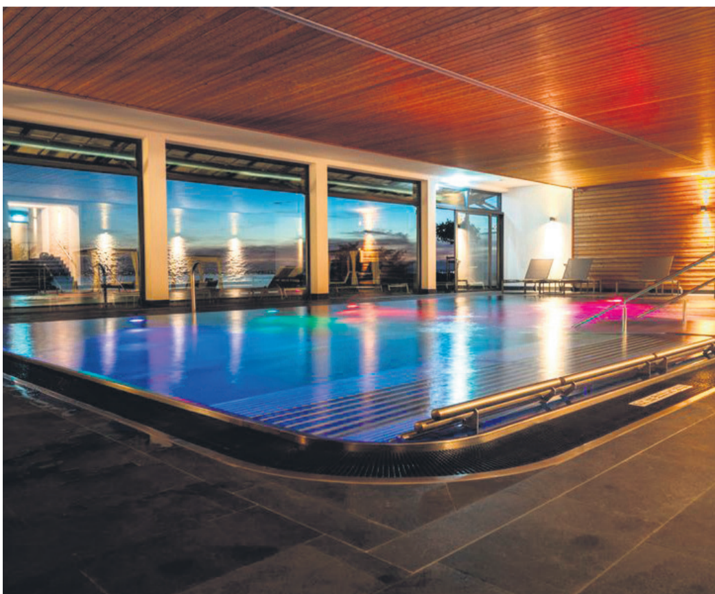
Die Aussicht auf den Bodensee lässt sich in den drei Thermen und in vielen Hotels auch vom warmen Pool aus genießen.

hopping im Vierländereck ein. Für kulturellen Genuss sorgen nicht nur das Zeppelin Museum in Friedrichshafen, das Hohenzollernschloss in Sigmaringen oder das Vineum in Meersburg, sondern auch zahlreiche Galerien. Auch Kirchen dienen als stimmungsvolle Kulisse für Konzerte, Lesungen und Spezial-Führungen. Weitere Genussmomente bieten auch die regionalen Produkte Fisch, Obst, Hopfen und Wein, die in der heimischen Gastronomie auf den Teller und ins Glas kommen.