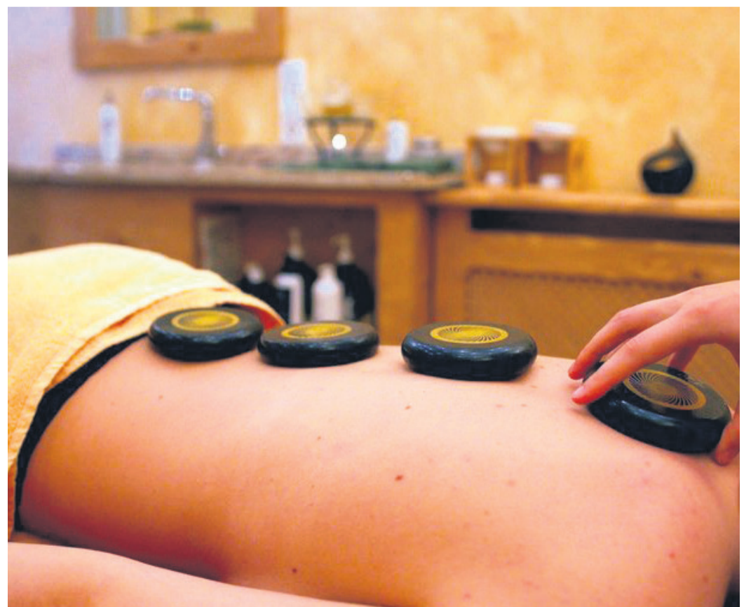
Wohltuende Anwendungen und viel Wärme erwartet Bodenseeurlauber in den Thermen der Region und in den Wellnessbereichen der Hotels.