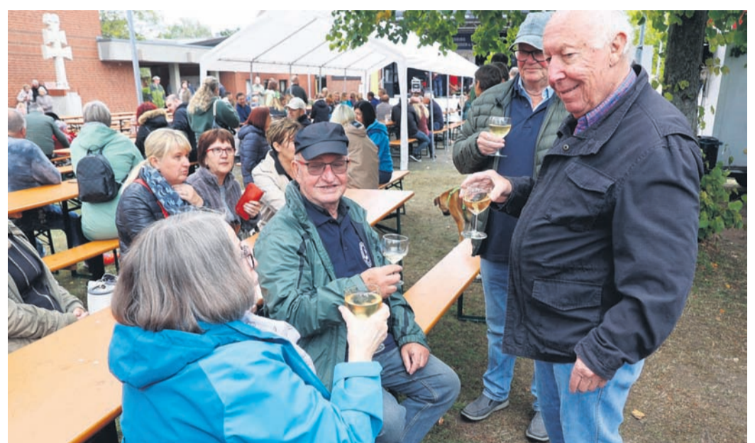
Tapfer trotzten die Besucher dem Regenwetter.