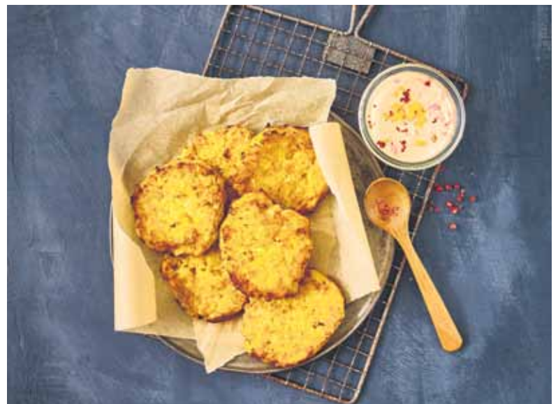
Lecker Herbstgericht: Die Kartoffel-Kürbis-Rösti passen prima zu einer würzigen Schmandcreme.

Die Kartoffel-Kürbis-Rösti schmecken ebenso gut zu Kräuterquark, knackigem Salat und geräuchertem Lachs. Wer möchte, kann die Rösti zusätzlich mit würzigem Bergkäse überbacken.