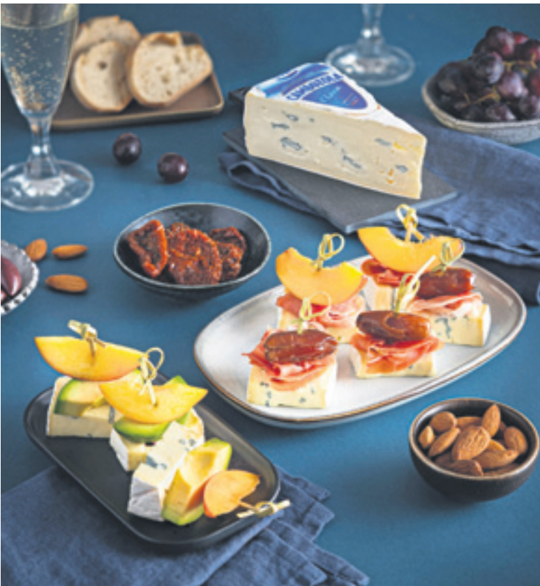
Die Spieße mit der Blauschimmel-Weichkäsespezialität kann man je nach Geschmack herzhaft oder süß kombinieren.