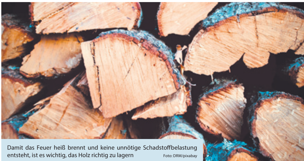
Damit das Feuer heiß brennt und keine unnötige Schadstoffbelastung entsteht, ist es wichtig, das Holz richtig zu lagern

Vor jedem neuen Feuer sollte die Brennkammer gereinigt werden, ebenfalls muss der Aschebehälter ausgeleert werden. Am besten landet alles in einem Eimer oder einer Wanne aus Metall, da sich in der Asche noch Funken und Glutreste befinden können. Ist die Asche abgekühlt, entsorgt man sie in der Mülltonne.