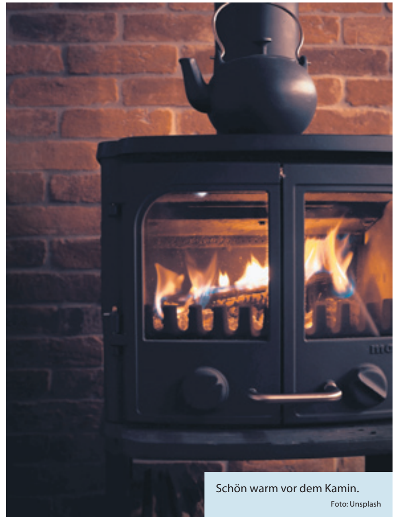
Schön warm vor dem Kamin.

Zum Anzünden des Feuers empfehlen sich Knäule aus Holzspänen, die es im Handel zu erwerben gibt. Aus Sicherheitsgründen sollte man keinen Spiritus oder andere flüssige Brandbeschleuniger verwenden, da