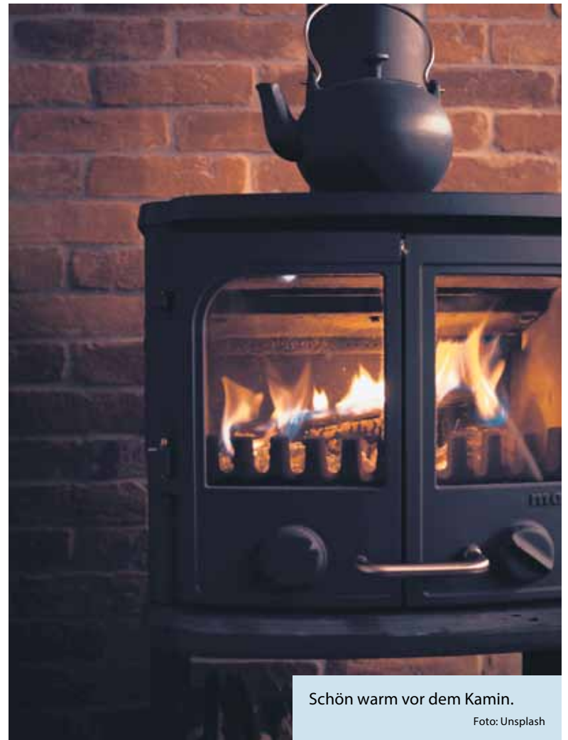
Schön warm vor dem Kamin.

Zum Anzünden des Feuers empfehlen sich Knäule aus Holzspänen, die es im Handel zu erwerben gibt. Aus Sicherheitsgründen sollte man keinen Spiritus oder andere flüssige Brandbeschleuniger verwenden, da