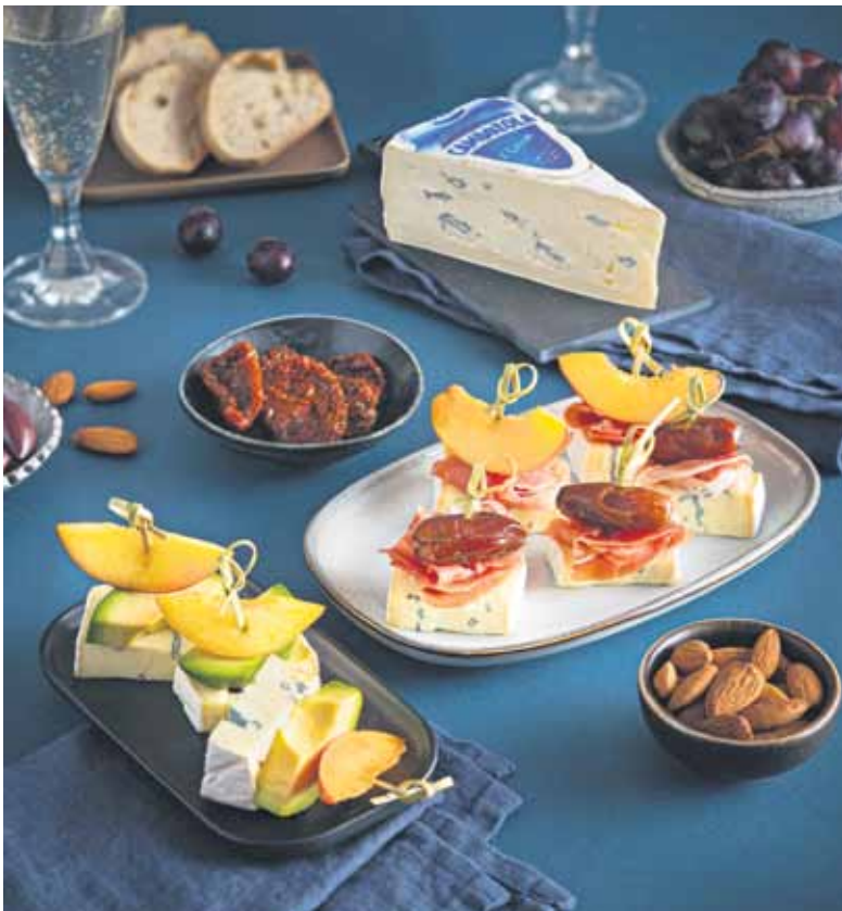
Die Spieße mit der Blauschimmel-Weichkäsespezialität kann man je nach Geschmack herzhaft oder süß kombinieren.