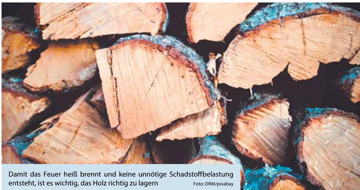
Damit das Feuer heiß brennt und keine unnötige Schadstoffbelastung entsteht, ist es wichtig, das Holz richtig zu lagern

Vor jedem neuen Feuer sollte die Brennkammer gereinigt werden, ebenfalls muss der Aschebehälter ausgeleert werden. Am besten landet alles in einem Eimer oder einer Wanne aus Metall, da sich in der Asche noch Funken und Glutreste befinden können. Ist die Asche abgekühlt, entsorgt man sie in der Mülltonne.