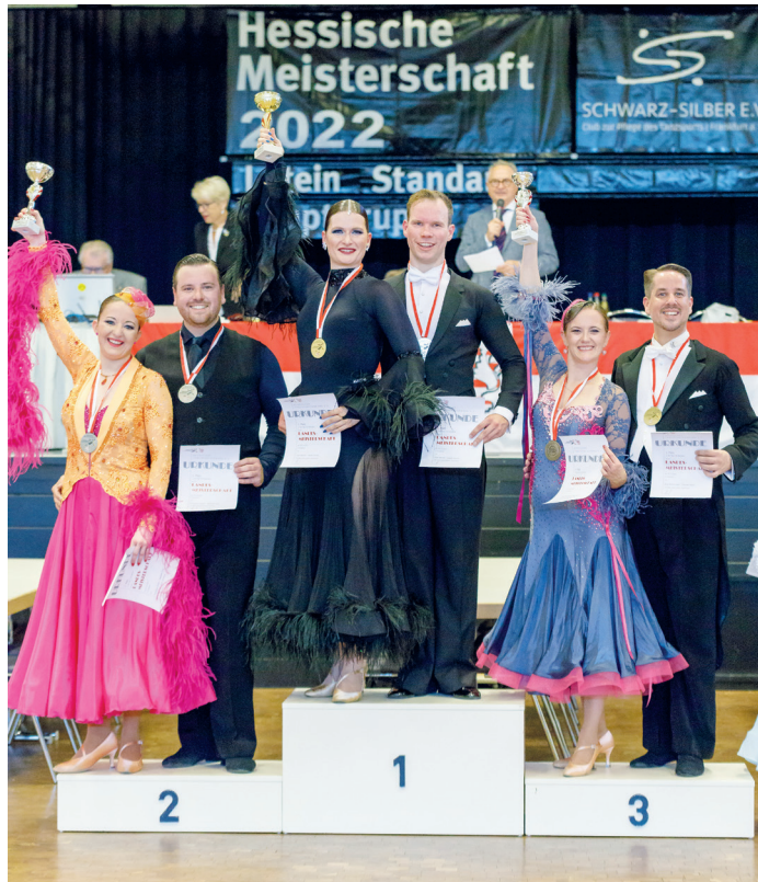
Das Bild zeigt die drei erfolgreichen Darmstädter Paare in der Hauptgruppe II B Standard.