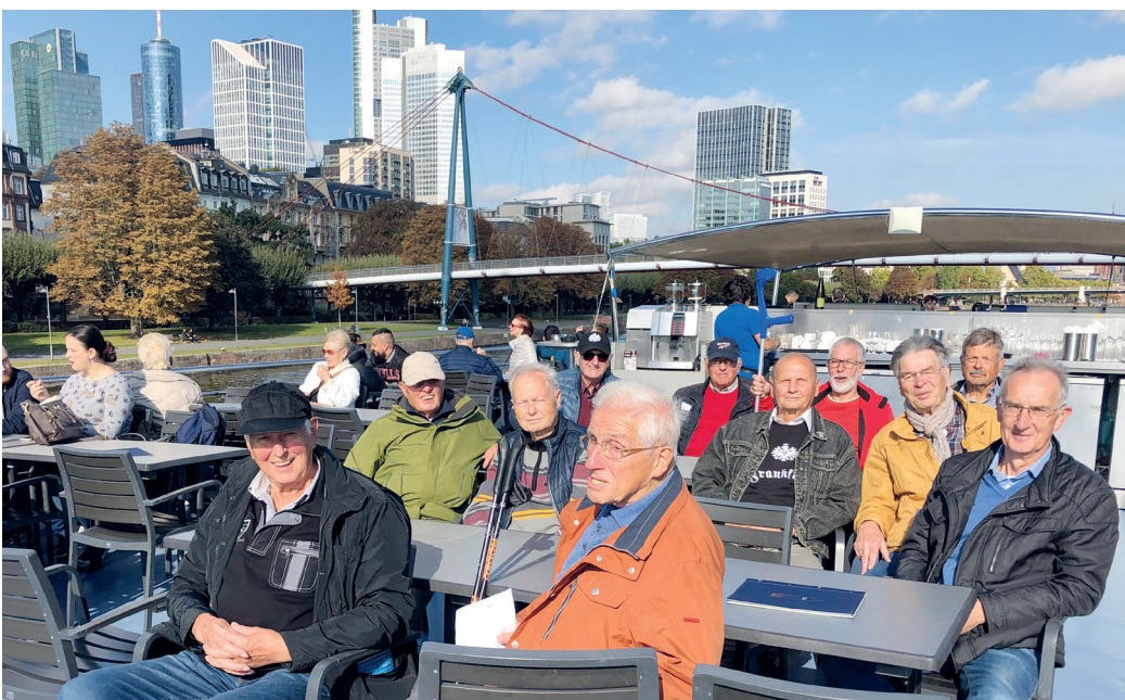
Die Erzhäuser Mittwochsradler auf dem Main vor der Frankfurter Skyline.

(Erzhausen, NOR) Wie der Name schon sagt, sind die Erzhäuser Mittwochsradler fast jeden Mittwoch mit dem Fahrrad unterwegs. Dabei werden üblicherweise Ziele in der näheren und weiteren Umgebung angesteuert. In den letzten Wochen gab es allerdings zwei Ausnahmen und die Räder blieben zu Hause. Beim ersten Mal stand das traditionelle Ackerfest auf dem Programm und als zweites war eine Mainschiffahrt