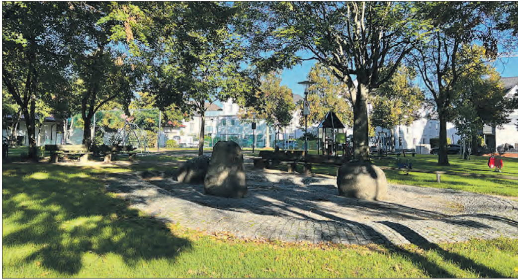
DIE BRUNNENANLAGE ist in die Jahre gekommen.