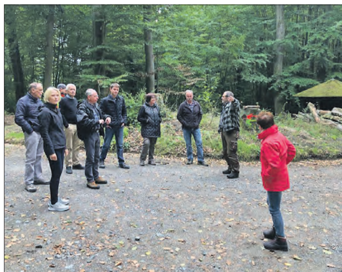
ORTSTERMIN im Gemeindewald.