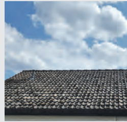
Dachreinigung & Beschichtung