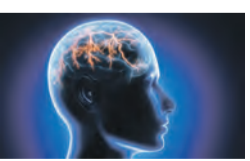
Die Deutsche Migräne- und Kopfschmerzgesellschaft e.V. (DMKG) geht von „350 000 Migräneanfällen täglich“ aus. 3

Für die Migräne-Prophylaxe gibt es bereits eine Reihe von verschreibungspflichtigen Medikamenten wie z.B. Beta-Blocker. Zwei Studien 1,2 zeigen: Der Mineralstoff Magnesium kann eine nicht verschreibungspflichtige, nebenwirkungsarme Alternative sein!