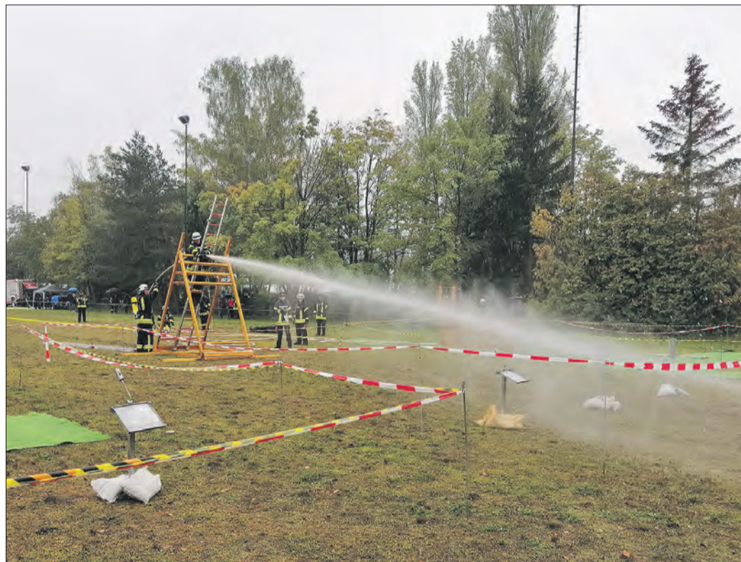
BEI DEN FEUERWEHRLEISTUNGSÜBUNGEN in Pfungstadt mussten sich die Teams auch praktischen Prüfungen stellen.