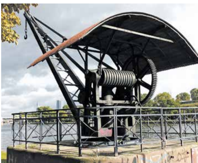
Beispielfoto aus dem Fotoworkshop des vergangenen Jahres.

Es handelt sich ausdrücklich nicht um einen Technikworkshop, vielmehr soll mit Blick auf ungewöhnliche Motive und Einstellungen auf fotografische Entdeckungstour in der Natur und einer Stadt gegangen werden, auch Portraits stehen auf der Agenda. Am Ende des Workshops kann jede Teilnehmerin und jeder Teilnehmer ein gerahmtes Top-Bild sowie fünf kleine Bilder mit nachhause nehmen.