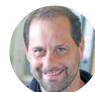
Peter Erbach Autohaus Iser Riedstadt