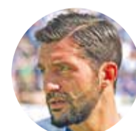
Aytac Sulu Lilienlegende

Zu tippen sind Spiele der hessischen Kultmannschaften Darmstadt 98 und Eintracht Frankfurt! Es gibt attraktive Preise zu gewinnen. Der beste Tipper eines jeden Monats wird belohnt.