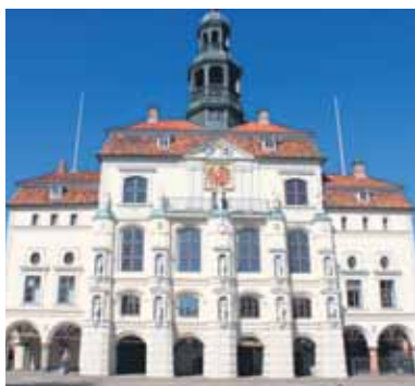
Das historische Rathaus ist noch heute Sitz der Stadtverwaltung und geht in seinen Grundmauern auf das Jahr 1230 zurück.

Eine Besonderheit der Stadt ist das Senkungsgebiet. Es handelt sich um das historische Viertel zwischen Saline und Kalkberg. Darunter liegt der Salzstock, der vom Grundwasser abgelaugt wird. Dadurch senkt sich die Oberfläche. Teilweise sackte das Erdreich im 19. Jahrhundert um mehrere cm pro Jahr ab. Darum mussten auch Häuser und Kirchen abgetragen werden. Die Senkungen werden überwacht und sind noch nicht zum Stillstand gekommen. Allerdings wurde das Gebiet neu bebaut, einige alte Gebäude restauriert. In der Frommestraße steht das Tor zur Unterwelt. Ursprünglich ein Gartentor, hat es sich mittlerweile um rund zwei Meter abgesenkt und veranschaulicht die geologische Situation. Mehr darüber erfährt man auch im Deutschen Salzmuseum in der ehemaligen Saline.