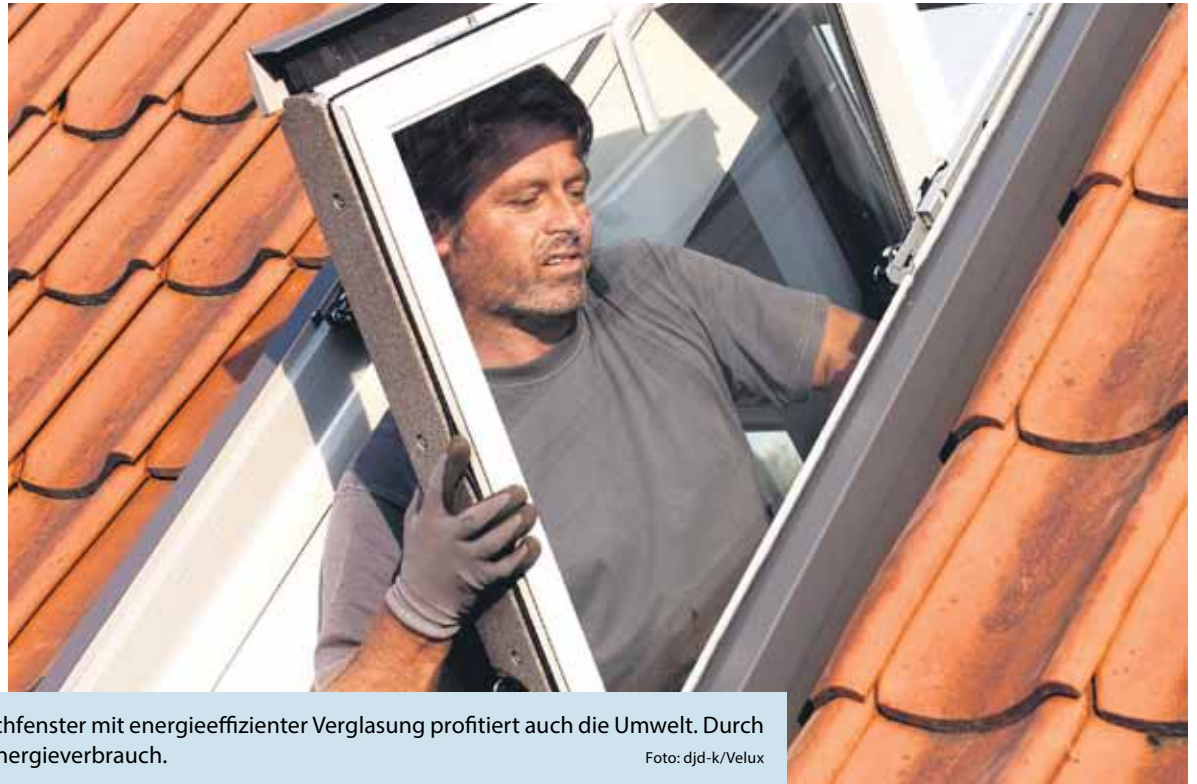
Vom Austausch alter gegen neue Dachfenster mit energieeffizienter Verglasung profitiert auch die Umwelt. Durch geringere Wärmeverluste sinkt der Energieverbrauch.

(DJD-K). Für die energetische Sanierung im Altbau und damit unter anderem für den Austausch alter Dachfenster stehen weiterhin staatliche Fördermittel bereit. Damit wird es möglich, höherwertige Fenster für einen geringeren Preis zu bekommen und durch das Sanieren auch noch einen persönlichen Beitrag zum Klimaschutz zu leisten. Ein Beispiel verdeutlicht, wie sehr Eigentümer profitieren können: Wenn jemand plant, ein altes Dachfenster etwa gegen ein neues Velux Klapp-Schwingfenster zu tauschen, und sich dabei für eine energieeffiziente Verglasung entscheidet, sind die Kosten dank des 20-prozentigen Zuschusses rund 450 Euro niedriger als bei einer Standardverglasung. Unter www.velux.de/förderung gibt es mehr Informationen dazu sowie einen nützlichen Fördergeld-Check.