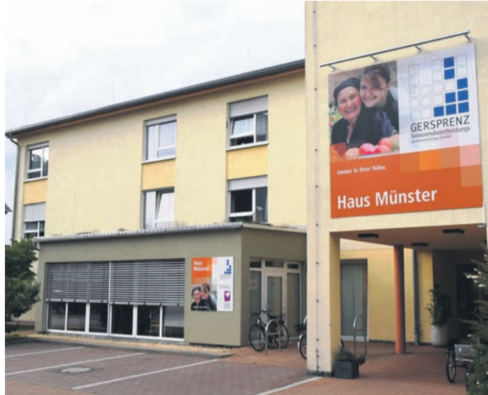
Das Gersprenz-Heim in Münster ist eins von sechs, das zum Senio-Verband gehört und wo die Pflege von der Seniorendienstleistungs-gGmbH Gersprenz betrieben wird. In Eppertshausen ist in all den Jahren der Verbandsmitgliedschaft und Umlagenzahlung kein Heim entstanden. Der Verband steht nun vor der Auflösung.

In sechs der acht genannten Kommunen - Münster, Groß-Zimmern, Groß-Umstadt, Fischbachtal, Groß-Bieberau und Reinheim - existieren Alten- und Pflegeeinrichtungen. Insgesamt können dort bis zu 236 pflegebedürftige Menschen versorgt werden, teils via Tagespflege oder ambulant betreutem Wohnen. Die Seniorendienstleistungs-gGmbH Gersprenz hat 286 Mitarbeiter, davon 265 Pflegekräfte. Im Reinheimer Haus sitzt auch die Geschäftsstelle des Senio-Verbands, der in den vergangenen Jahren immer wieder durch seine unprofessionelle Struktur (und Pannen bei den Neubauten in Groß-Bieberau und Fischbachtal) von sich reden machte.