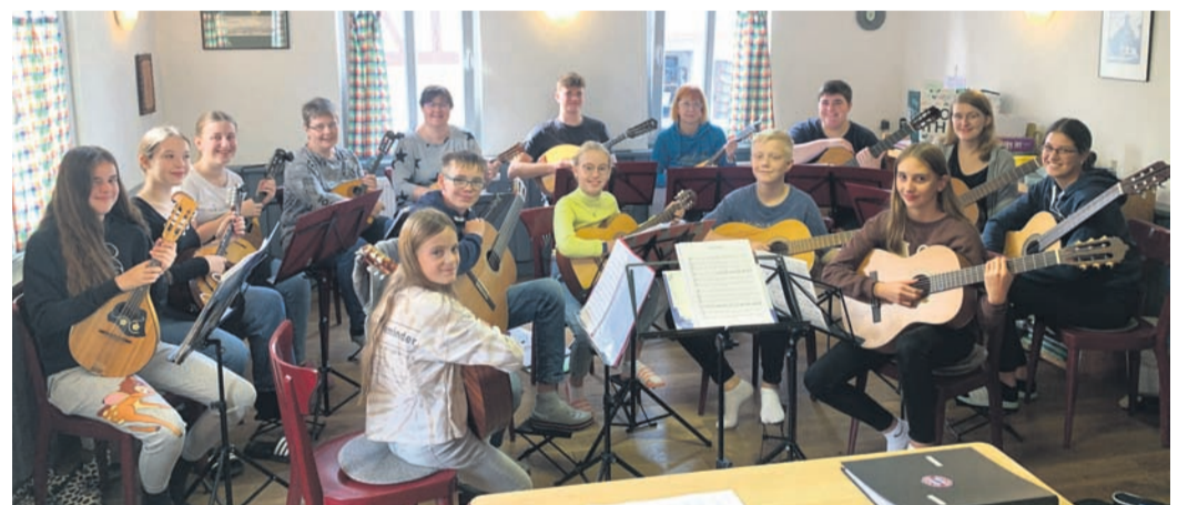
Das Jugendzupforchester des OWK probte intensiv für das Konzert im kommenden März.

Jugendzupforchester des OWK Eppertshausen auf Probenwochenende in Knoden