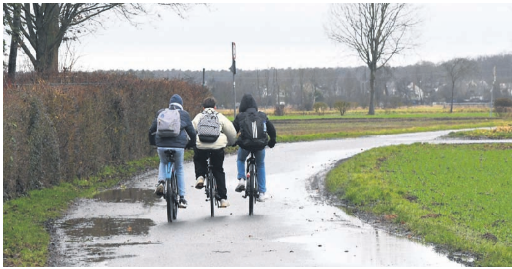
Der Rad- und Fußweg zwischen Münster und Eppertshausen wird unter anderem von vielen Eppertshäuser Kindern genutzt, die zur Aue-Schule radeln. Der Eppertshäuser Teil des Wegs wird nächstes Jahr erneuert, was umstritten ist.