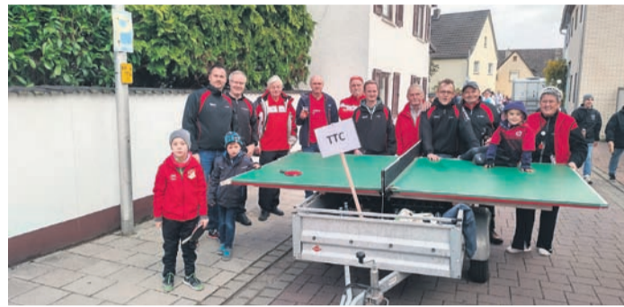
Mit insgesamt 16 aktiven und passiven Mitgliedern nahm der TTC am Kerbumzug teil.

Der Jahresabschluss mit dem Rechenschaftsbericht liegt gemäß § 114 HGO vom 7. bis einschließlich 17. Oktober zur