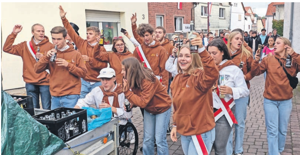
Die 27 Kerburschen und -mädels feierten ausgiebig, dass sie 2022 im Mittelpunkt stehen.

Stiftungsfest: Am Samstag, 16. Oktober, feiert man das Stiftungsfest. Man beginnt um 10.30 Uhr mit einem Gottesdienst in der Pfarrkirche. Anschließend begrüßt man Besucher im Haus der Vereine mit einem kleinen Mittagessen und zu Kaffee und Kuchen. Für Kuchenspende bei Astrid Vieth melden (Tel. 0177/3721333 oder astrid.vieth@kolping-eppertshausen.de).