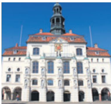
Das historische Rathaus ist noch heute Sitz der Stadtverwaltung und geht in seinen Grundmauern auf das Jahr 1230 zurück.

Eine Besonderheit der Stadt ist das Senkungsgebiet. Es handelt sich um das historische Viertel zwischen Saline und Kalkberg. Darunter liegt der Salzstock, der vom Grundwasser abgelaugt wird. Dadurch senkt sich die Oberfläche. Teilweise sackte das Erdreich im 19. Jahrhundert um mehrere cm pro Jahr ab. Darum mussten auch Häuser und Kirchen abgetragen werden. Die Senkungen werden überwacht und sind noch nicht zum Stillstand gekommen. Allerdings wurde das Gebiet neu bebaut, einige alte Gebäude restauriert. In der Frommestraße steht das Tor zur Unterwelt. Ursprünglich ein Gartentor, hat es sich mittlerweile um rund zwei Meter abgesenkt und veranschaulicht die geologische Situation. Mehr darüber erfährt man auch im Deutschen Salzmuseum in der ehemaligen Saline.