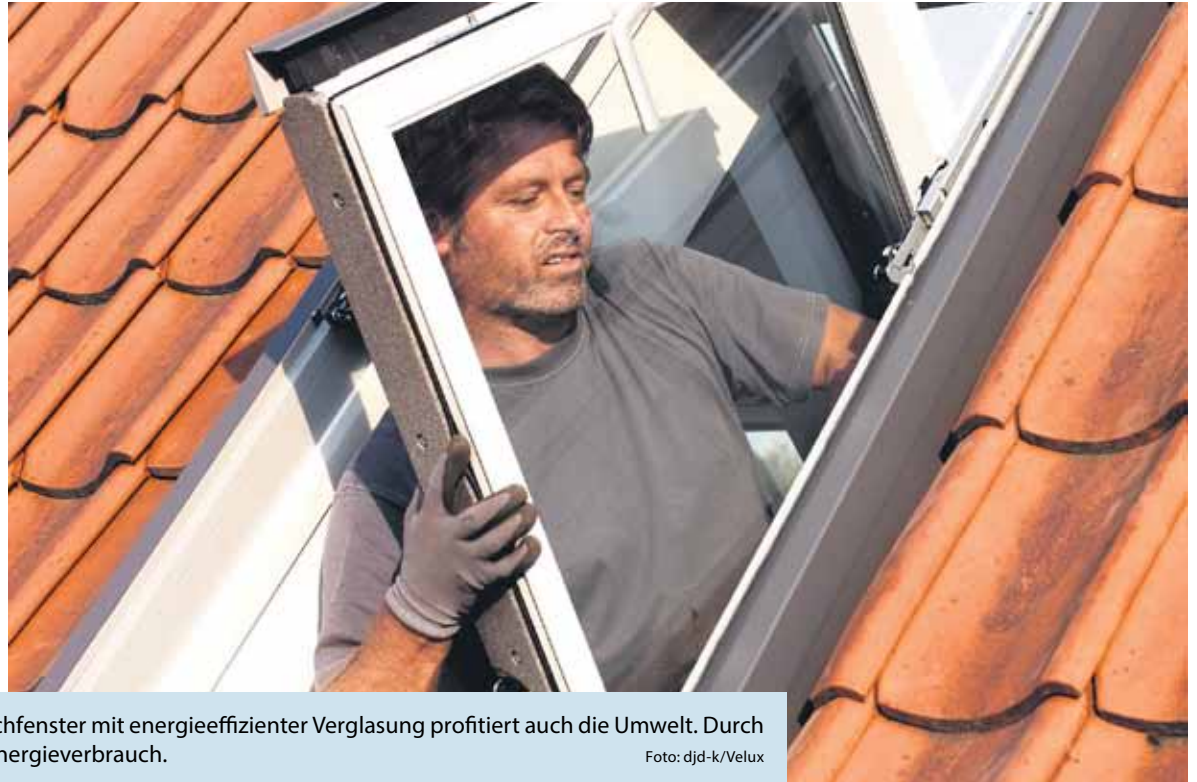
Vom Austausch alter gegen neue Dachfenster mit energieeffizienter Verglasung profitiert auch die Umwelt. Durch geringere Wärmeverluste sinkt der Energieverbrauch.

(DJD-K). Für die energetische Sanierung im Altbau und damit unter anderem für den Austausch alter Dachfenster stehen weiterhin staatliche Fördermittel bereit. Damit wird es möglich, höherwertige Fenster für einen geringeren Preis zu bekommen und durch das Sanieren auch noch einen persönlichen Beitrag zum Klimaschutz zu leisten. Ein Beispiel verdeutlicht, wie sehr Eigentümer profitieren können: Wenn jemand plant, ein altes Dachfenster etwa gegen ein neues Velux Klapp-Schwingfenster zu tauschen, und sich dabei für eine energieeffiziente Verglasung entscheidet, sind die Kosten dank des 20-prozentigen Zuschusses rund 450 Euro niedriger als bei einer Standardverglasung. Unter www.velux.de/förderung gibt es mehr Informationen dazu sowie einen nützlichen Fördergeld-Check.