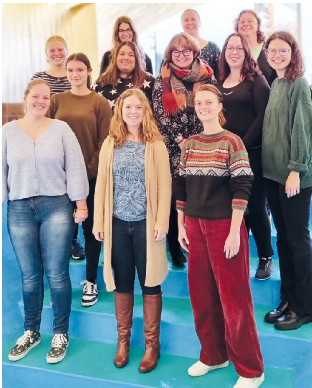
Veränderung gemeinsam mit den Mitgliedern Vereinsarbeit

Am 02. Oktober fand nun die erste Klausursitzung statt, in welcher der Vorstand die verschiedenen Aufgabenbereiche definiert und die Zukunft des Vereins geplant hat. Der neue Vorstand freut sich durch diese strukturelle