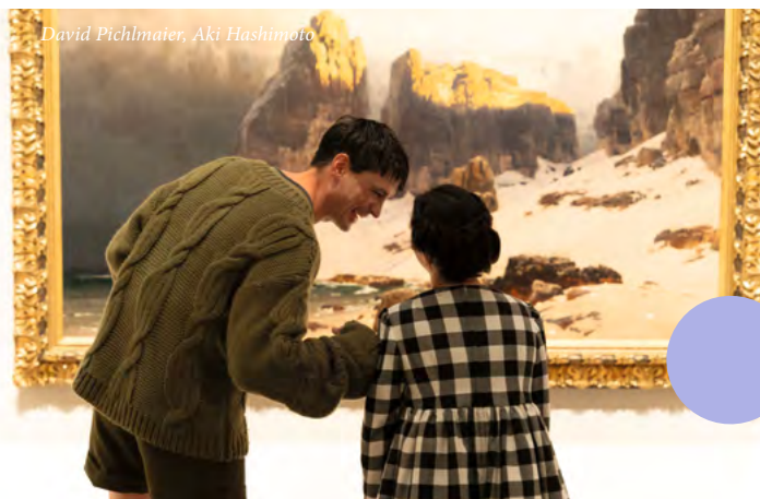
Gemälde: Eugen Bracht, Das Gestade der Vergessenheit, 1889