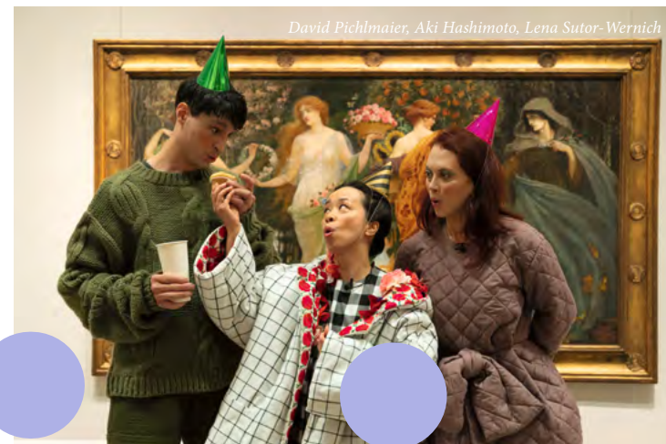
Gemälde: Walter Crane, A Masque of the Four Seasons, 1905 – 1909