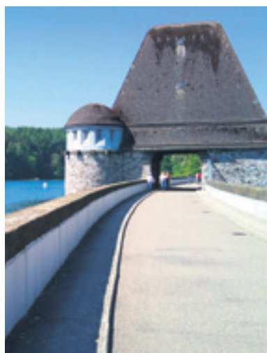
Der Möhnesee wird durch die Staumauer bei Günne aufgestaut und dient der Versorgung des Ruhrgebiets mit Wasser.

Die rund 40 km Uferlänge, dazu der Arnberger Wald – rund um den See gibt es für jeden die richtige Fahrradrouten. Ob gemütlich mit der Familie den See entlang, oder sportlich die Höhenzüge des Sauerlands erklimmen. Für die Radfahrer gibt es zwei einfache Möglichkeiten, sich zu bewegen. Entweder „Radeln nach Zahlen“, oder auf festen Routen. Dabei gibt es beim „Radeln nach Zahlen“ immer Knotenpunkte, von denen aus man einfach wieder den Weg zurückfindet, wenn die Anstrengungen zu groß werden. Besonders ist der Skulpturenradweg WEGMARKEN. Dieser führt vorbei an zwölf Kunstwerken, die im Rahmen eines Kunstprojekts angelegt wurden. Hier erfährt man vieles über die Geschichte der Möhnetalsperre. Aber auch Eisenbahnstalgiker kommen auf ihre Kosten. Auf den Spuren der alten Möhnetalbahn verläuft heute der Möhnetalradweg. Dieser führt von der Quelle bis zur Mündung der Möhne in die Ruhr.