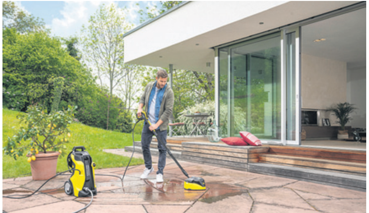
Ein Terrassenreiniger mit rotierenden Bürstenwalzen und kontinuierlicher Wasserzufuhr ermöglicht die schonende Reinigung von Holzoberflächen.

(DJD-K). Auf der Terrasse zeigen sich grüne Ablagerungen, die Gartenmöbel sind staubig und der Hof voller Blütenblätter: Nicht nur im Frühling will der Outdoorbereich gründlich von Schmutz befreit werden. Mit technischen Geräten können sich Hausbesitzer das große Säubern erleichtern. Blätter und Dreck auf Wegen und Stellplätzen werden beispielsweise am schnellsten mit einer Handkehrmaschine aufgenommen. Auf der Terrasse oder in der Garage hingegen kann ein Nass- und Trockensauger zum Einsatz kommen. Will man festsitzenden Schmutz, Moose und Flechten entfernen, leistet ein Hochdruckreiniger gute Dienste. Besonders gleichmäßig und zügig klappt die Arbeit mit einem zusätzlichen Flächenreiniger, der statt der Hochdrucklanze angeschlossen wird – weitere Infos gibt es unter www.kaercher.de .