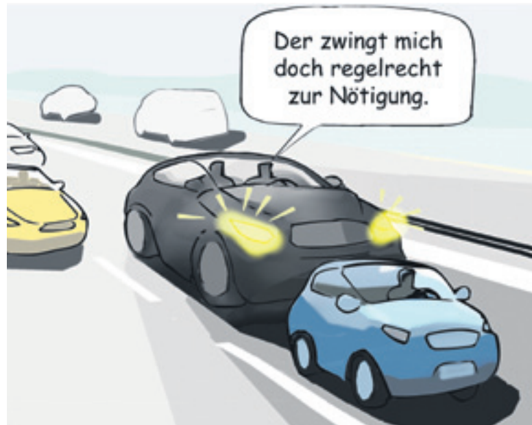
Falsche Reaktion auf Drängler: Demonstratives Langsamfahren auf dem linken Fahrstreifen trägt zur Eskalation bei.

Wenn man sich durch einen Drängler unter Druck gesetzt fühlt, sollte man nicht hartnäckig auf sei-