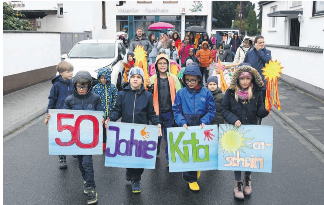
Mit einem kleinen Umzug vom Haus Sebastian zur Abteistraße läuteten einige aktuelle und ehemalige Kids der Eppertshäuser Kita „Sonnenschein“ das 50-jährige Bestehen am heutigen Standort ein.

lung der Einrichtung begleitet und ist die richtige Person, um zum „Runden“ wichtige Meilensteine aus fünf Jahrzehnten Revue passieren zu lassen. „Von den Räumlichkeiten her hat sich viel geändert“, blickt sie zurück. „In den 90ern wurden die lichtdurchfluteten Wintergärten angebaut. In den 2000ern errichtete man dann das Nebengebäude, das zunächst für eine Kindergarten-Gruppe genutzt wurde.“ In dieser Zeit erreichte die Kita mit 125 Kindern ihren Höchststand. Seit etwa einem Jahrzehnt dient das Nebengebäude als Krippe. Zehn U3-Kids besuchen die Kita Sonnenschein aktuell. Hinzu kommen vier klassische Ü3-Gruppen mit 90