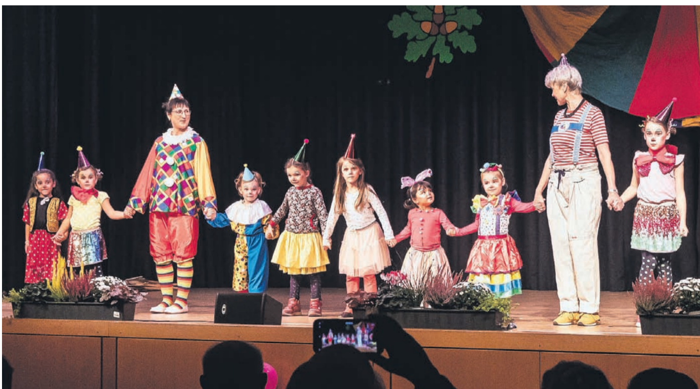
Der Odenwaldklub Eppertshausen verwandelte am Samstag die Bürgerhalle beim traditionellen Familienabend in ein Zirkuszelt.