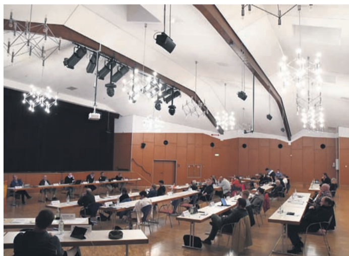
Im großen Saal der Kulturhalle wird schon auf eine eingeschränkte Beleuchtung geachtet - nur acht der 17 Lampen waren am Montagabend an, sind zudem bereits auf LED-Birnen umgestellt. Bei der Weihnachtsbeleuchtung soll es in diesem Jahr ebenfalls zu einer Reduzierung des Stromverbrauchs kommen.