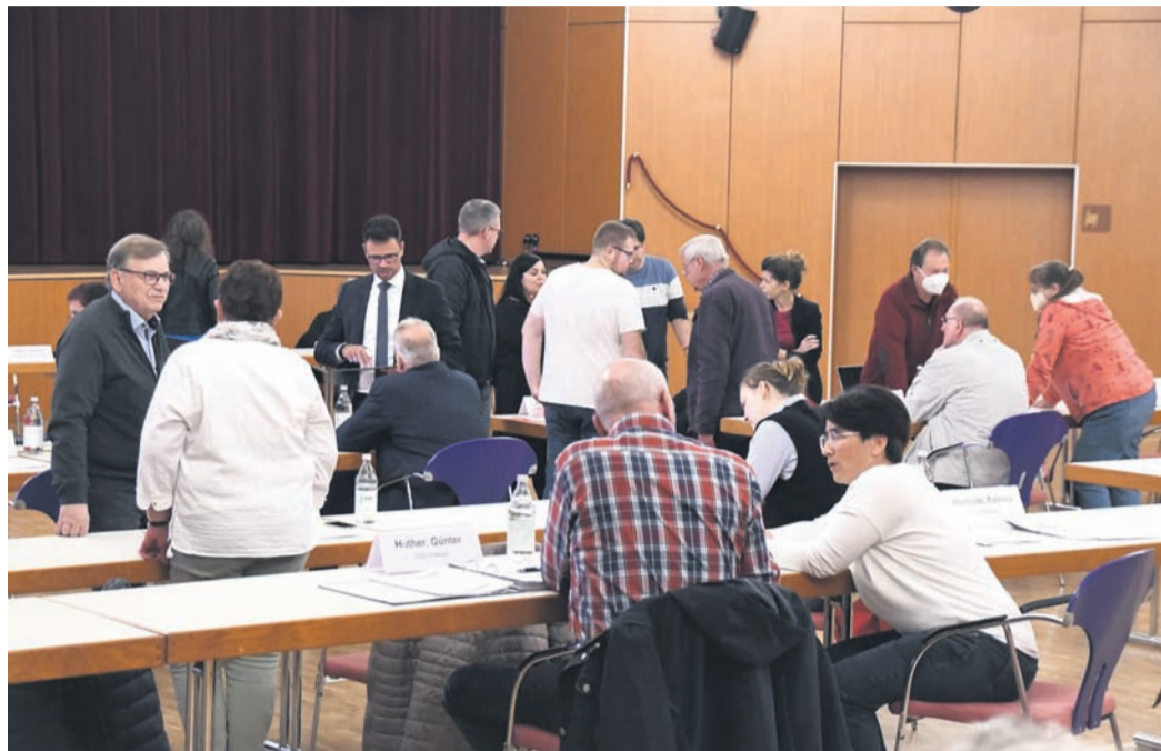
Gleich zweimal steckten die Münsterer Gemeindevertreter am Montagabend die Köpfe in Sitzungsunterbrechungen zusammen. Dabei entstand unter anderem der gemeinsame Antrag von ALMA-Die Grünen und FDP zum Spagat bei der diesjährigen Weihnachtsbeleuchtung.