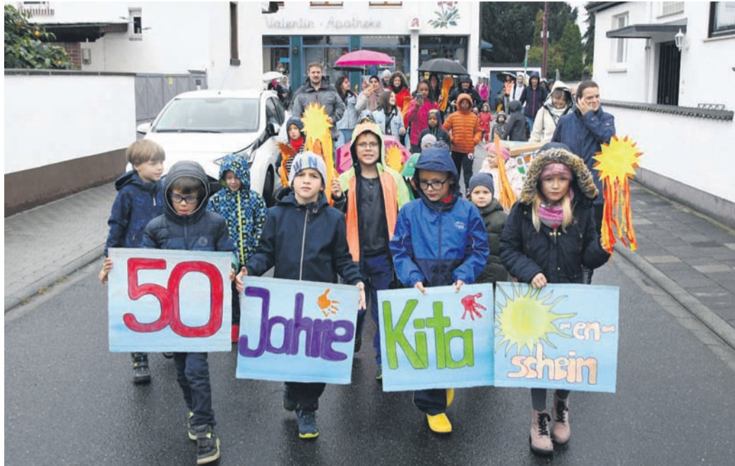
Mit einem kleinen Umzug vom Haus Sebastian zur Abteistraße läuteten einige aktuelle und ehemalige Kids der Eppertshäuser Kita „Sonnenschein“ das 50-jährige Bestehen am heutigen Standort ein.

lung der Einrichtung begleitet und ist die richtige Person, um zum „Runden“ wichtige Meilensteine aus fünf Jahrzehnten Revue passieren zu lassen. „Von den Räumlichkeiten her hat sich viel geändert“, blickt sie zurück. „In den 90ern wurden die lichtdurchfluteten Wintergärten angebaut. In den 2000ern errichtete man dann das Nebengebäude, das zunächst für eine Kindergarten-Gruppe genutzt wurde.“ In dieser Zeit erreichte die Kita mit 125 Kindern ihren Höchststand. Seit etwa einem Jahrzehnt dient das Nebengebäude als Krippe. Zehn U3-Kids besuchen die Kita Sonnenschein aktuell. Hinzu kommen vier klassische Ü3-Gruppen mit 90