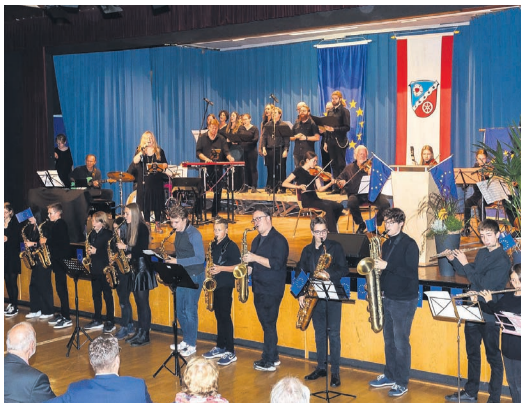
Die Europafahne ging nach Rodgau.