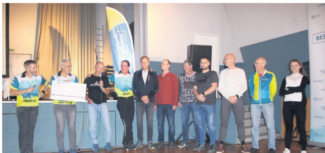
Freude über eine Spende in Höhe von 7374 Euro, die bei einer Tour nach Prag gesammelt wurde.

oder Autoimmunerkrankungen leiden und in finanzielle Nöte geraten sind. Auch der Ausblick auf das kommende Jahr stimmte optimistisch, da wieder viele Touren und Aktionen geplant sind. Weitere Infos auf der Homepage https://stiftung.besiandfriends.de/ .