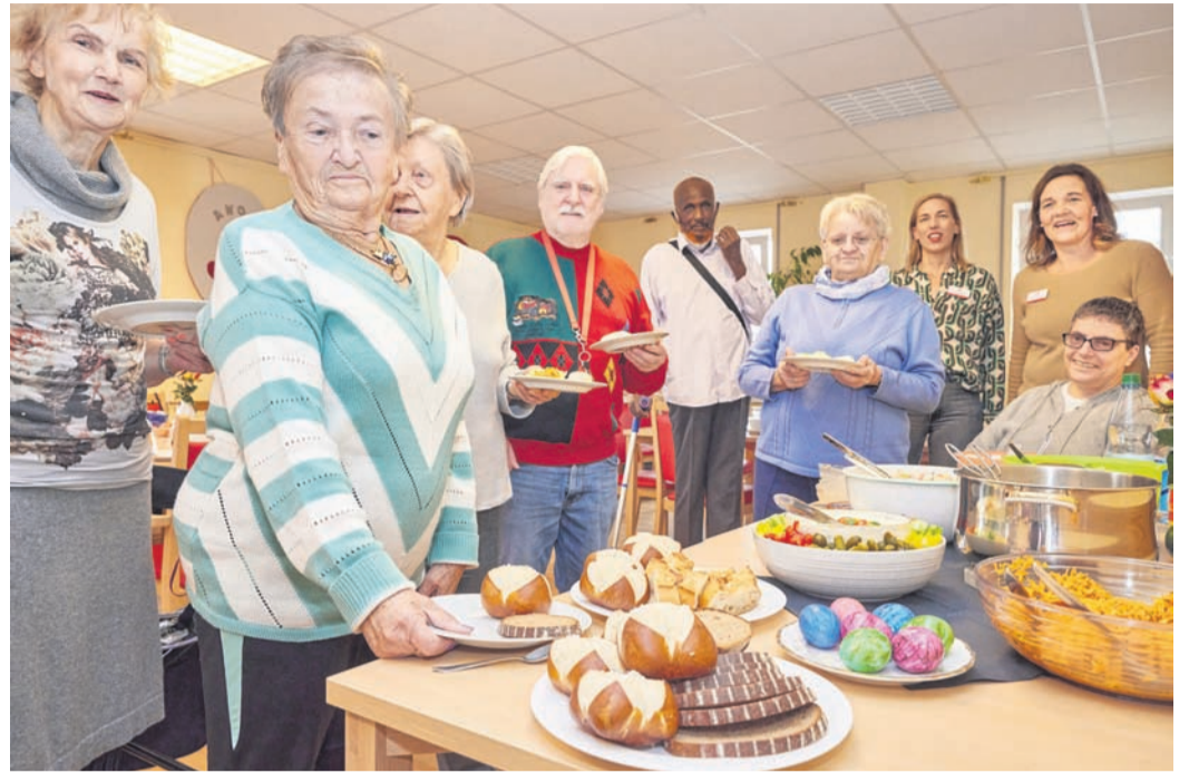
Rege Beteiligung beim Herbst-Brunch im Horst-Warnecke-Haus.