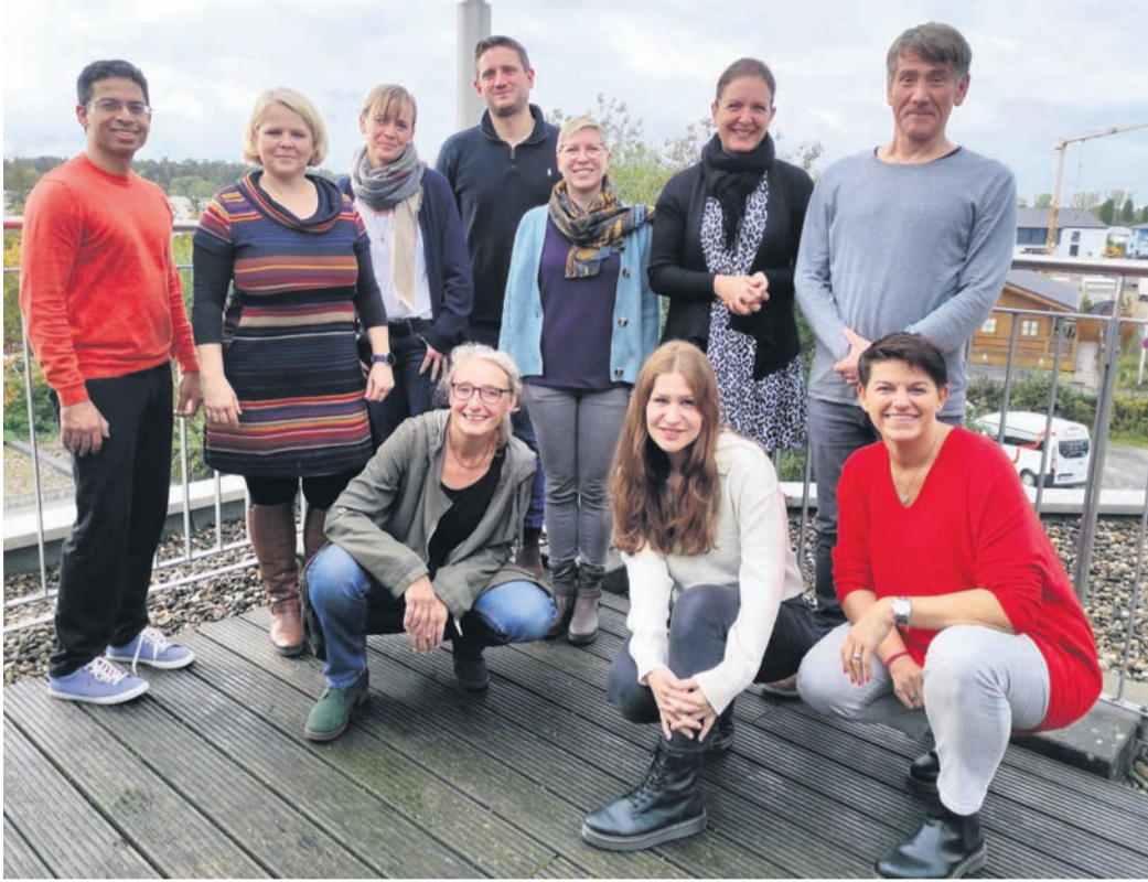
Während ihrer halbjährlichen Ausbildung haben die neuen Ehrenamtlichen einen Teil ihrer Freizeit geopfert, um sich auf ihre neue Aufgabe vorzubereiten.