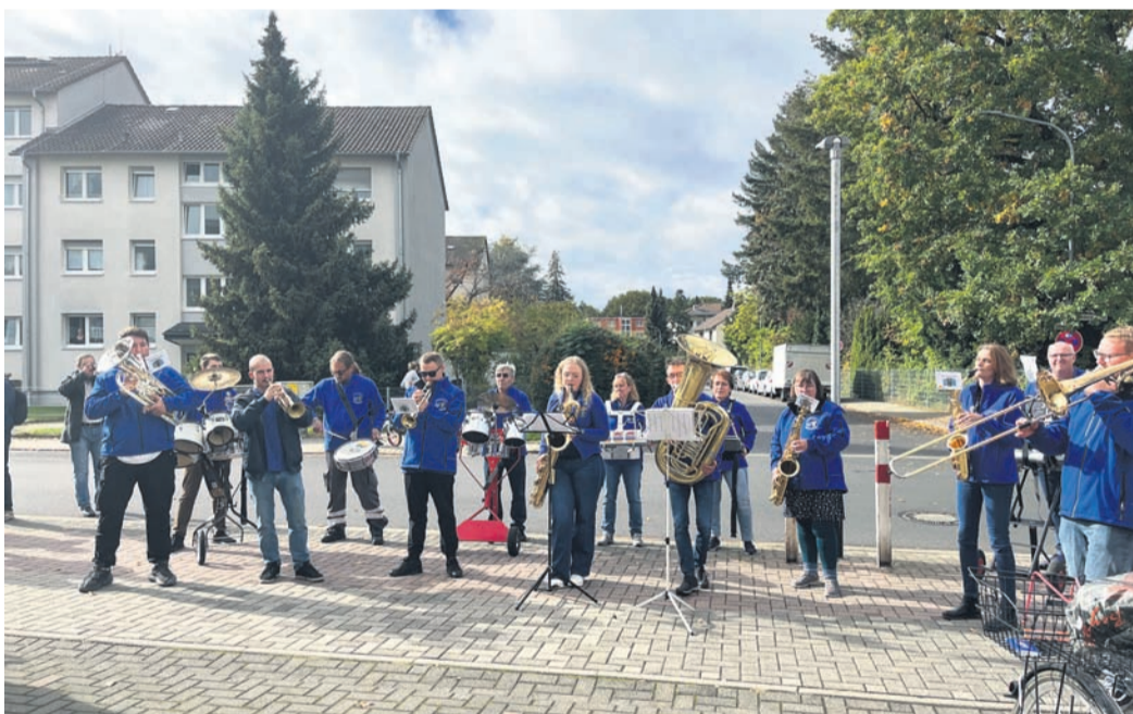
Die Nodebabbscher der Elf Babbscher waren vor Ort und sorgten für die musikalische Umrahmung.