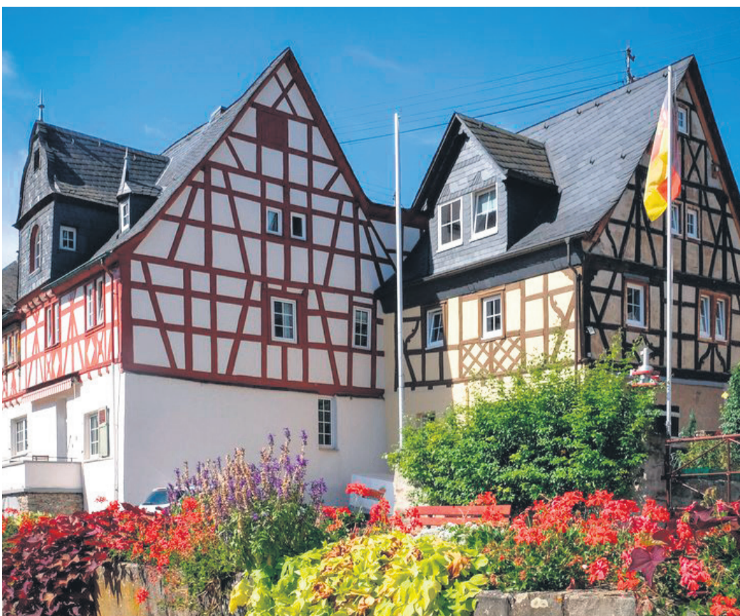
Die imposanten Fachwerkbauten in Spay sind charakteristisch für die Orte am Rheinbogen.

Informationen für Besucher gibt es etwa unter www.erlebnis-rheinbogen.de .