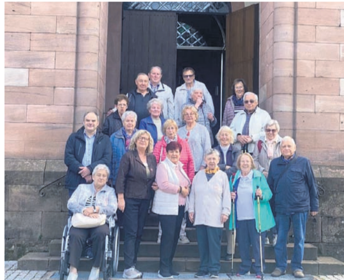
Das Bild zeigt die Gruppe vor der St Gallus Kirche.

Weitere Stationen waren der Tittisee, in Tribberg der Wallfahrts-