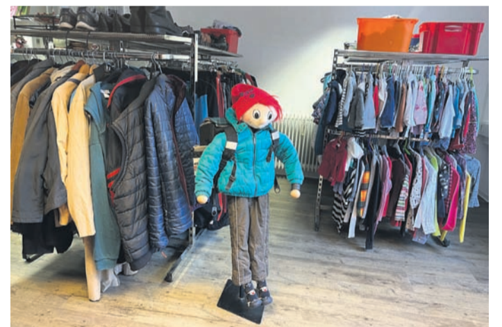
Sozialzentrum des DRK Hausen.