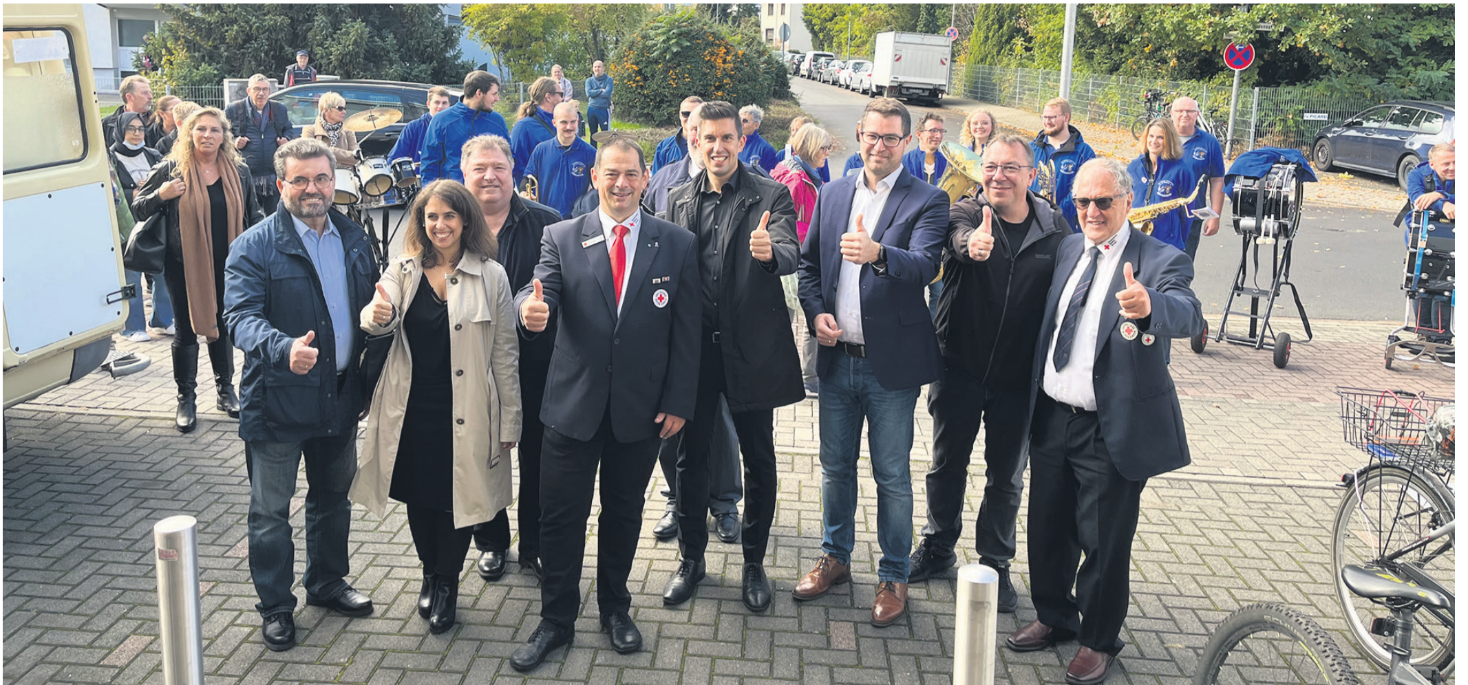
Zahlreiche Besucher fanden sich am Samstag beim DRK Hausen ein.