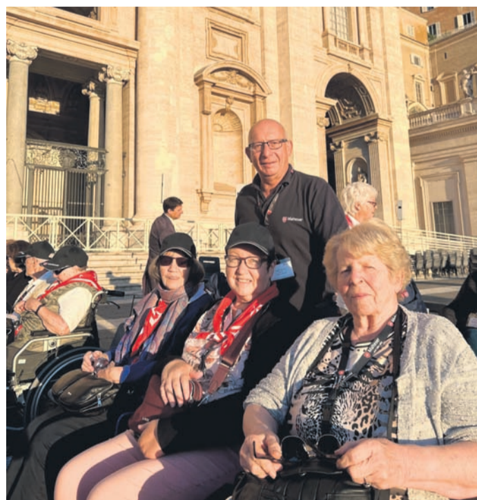
Obertshäuser Pilger vor dem Petersdom.