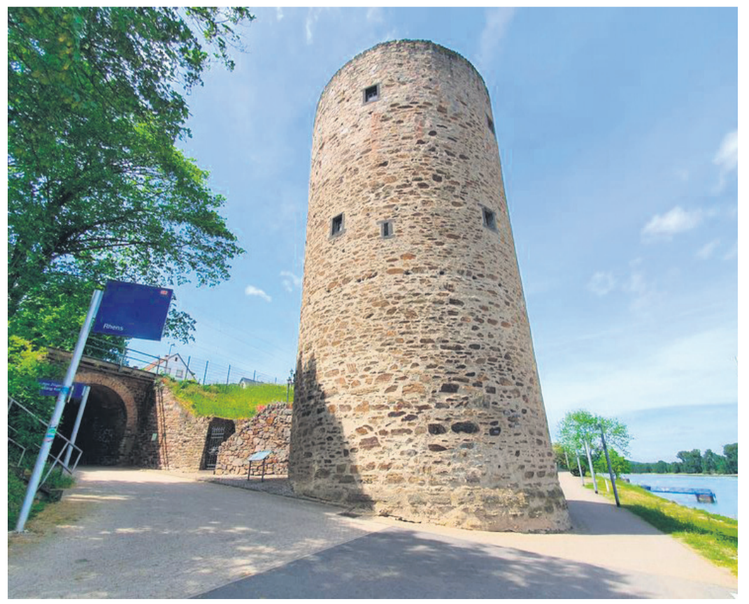
Der Scharfe Turm in der Stadtmauer von Rhens diente als Späh- und Zollturm, im Mittelalter als Gefängnis- und Hexenturm.