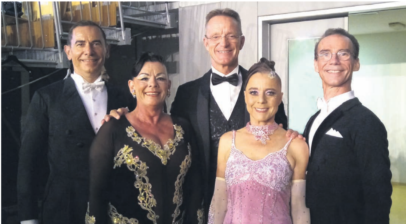
Grund zum Strahlen hatten die Paare der Tanz-Sport-Manufaktur Ballroom Performance Obertshausen e.V. Bei den International Championships in Koper / Slowenien lief es richtig gut für sie.

Am 28. Januar folgen die große Prunksitzung in der Mehrzweckhalle und am 10. Und 11. Februar die traditionellen Kappenabende im Bürgerhaus. Nach der erfolgreichen Premiere der Kinderfastnacht BaKiFa vor drei Jahren soll es am 12. Februar wieder eine Kinderfastnachtsveranstaltung im Bürgerhaus geben. Mit der Exthronisation der Tollitäten am 21. Februar endet dann die fünfzehnte Kampagne des Obertshäuser Karnevalsvereins.