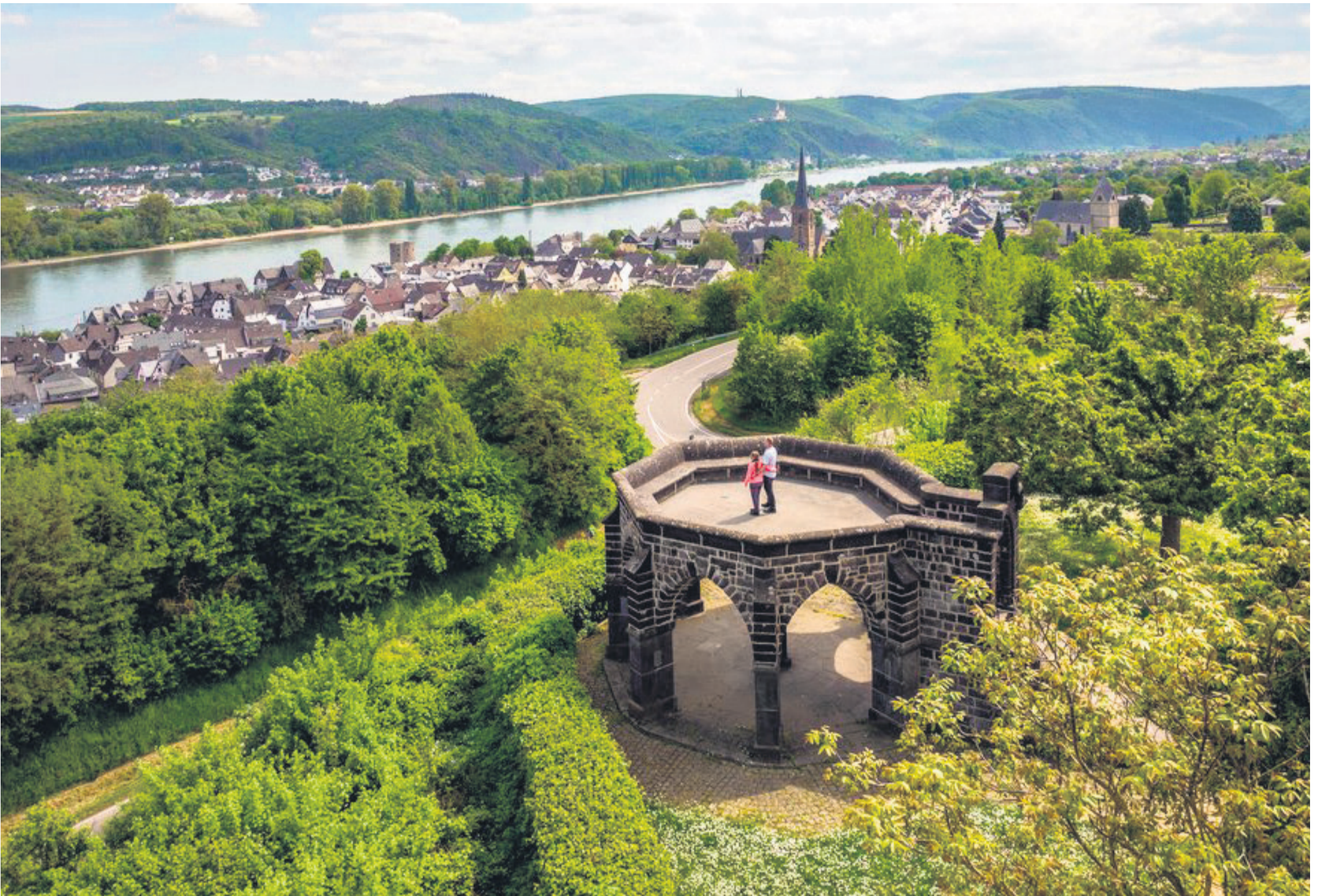
Am Königsstuhl von Rhens fanden im Mittelalter Verhandlungen der Kurfürsten zur Wahl der römisch-deutschen Könige statt.