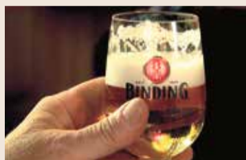
Aus für Frankfurter Bier.

In der halbstündigen Reisereportage stellen Prominente „ihre“ Reiseziele vor. Zu sehen immer samstags um 21:00 Uhr. Im Oktober nimmt uns Schauspieler und Umweltschützer Hannes Jaenecke mit in die Karibik. Die Cayman Islands mit ihren rund 65.000 Einwohnern sind nicht nur als internationaler Finanzplatz bekannt, sondern auch als Naturparadies. Tierschutzorganisationen und Insulanern ist es gelungen, die Cayman Islands als Zufluchtsort für seltene Arten wie Meeresschildkröten, Stachelrochen und den Blauen Leguan zu etablieren.