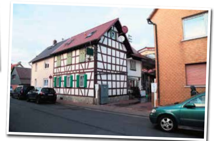
Die Landmetzgerei befindet sich in einem wunderschönen Fachwerkhaus.

Der Vertrieb wird ebenfalls von der Familie übernommen. Mehrmals die Woche steht sie auf den Wochenmärkten und verkauft ihre Waren. Stände sind auf dem Schillermarkt sowie in Dornbusch zu finden.