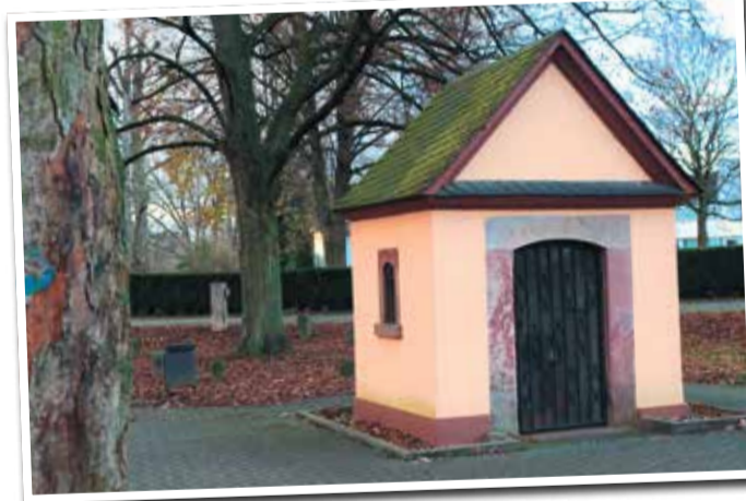
Die kleine Marienkapelle und der dahinterliegende Grenzsteingarten befinden sich in der Eschbachau.