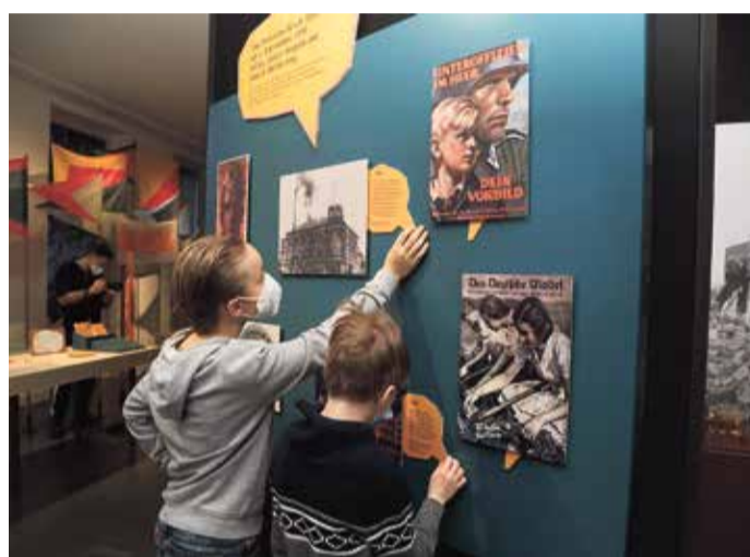
Junge Museumsbesucher in der Ausstellung „Nachgefragt: Frankfurt und der NS“.

Das Junge Museum Frankfurt feiert in den Herbstferien seinen 50. Geburtstag