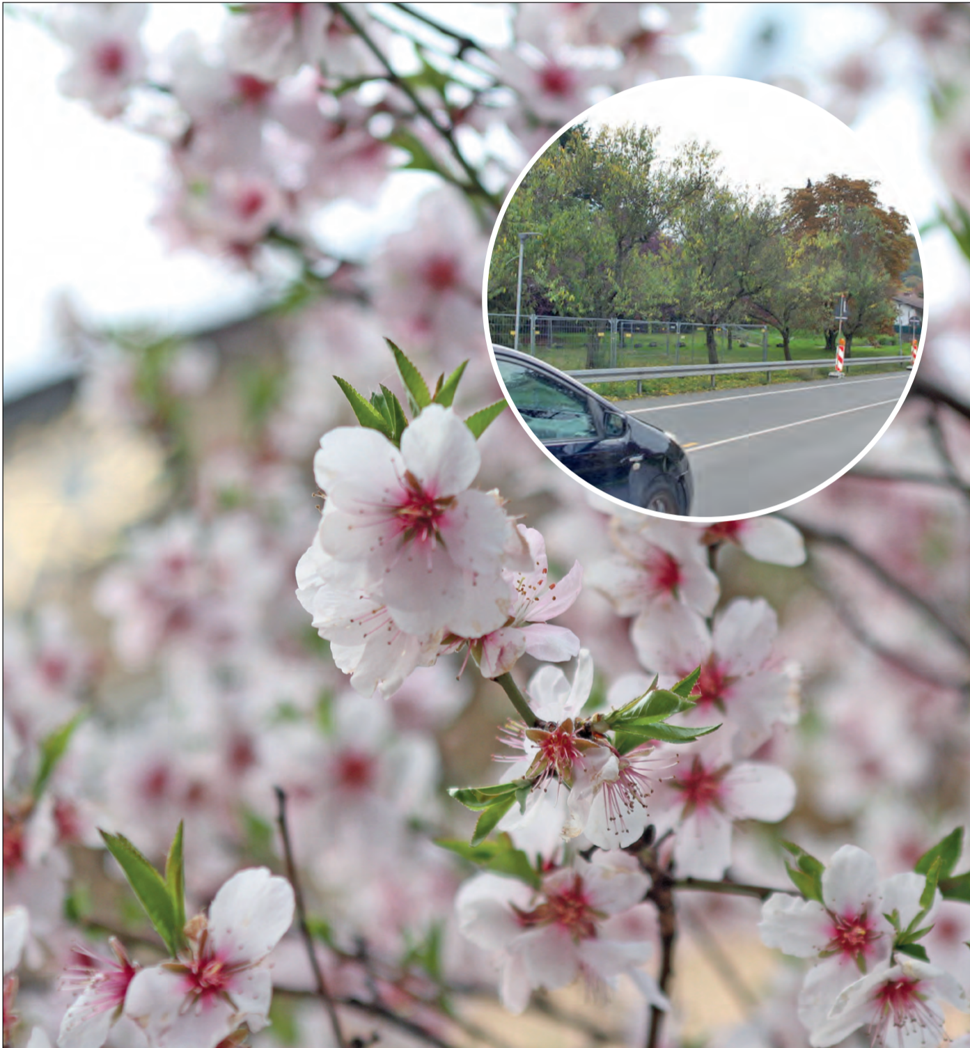
Sind durch den Pilz Monilia laxa geschädigt und müssen gefällt werden: Die vier Mandelbäume an der Heidelberger Straße in Höhe der Baustelle fürs Forum am Rathaus.