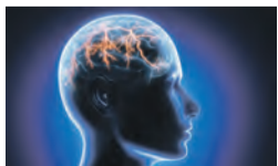
Die Deutsche Migräne- und Kopfschmerzgesellschaft e.V. (DMKG) geht von „350 000 Migräneanfällen täglich“ aus. 3

Für die Migräne-Prophylaxe gibt es bereits eine Reihe von verschreibungspflichtigen Medikamenten wie z. B. Beta-Blocker. Zwei Studien 1,2 zeigen: Der Mineralstoff Magnesium kann eine nicht verschreibungspflichtige, nebenwirkungsarme Alternative sein!