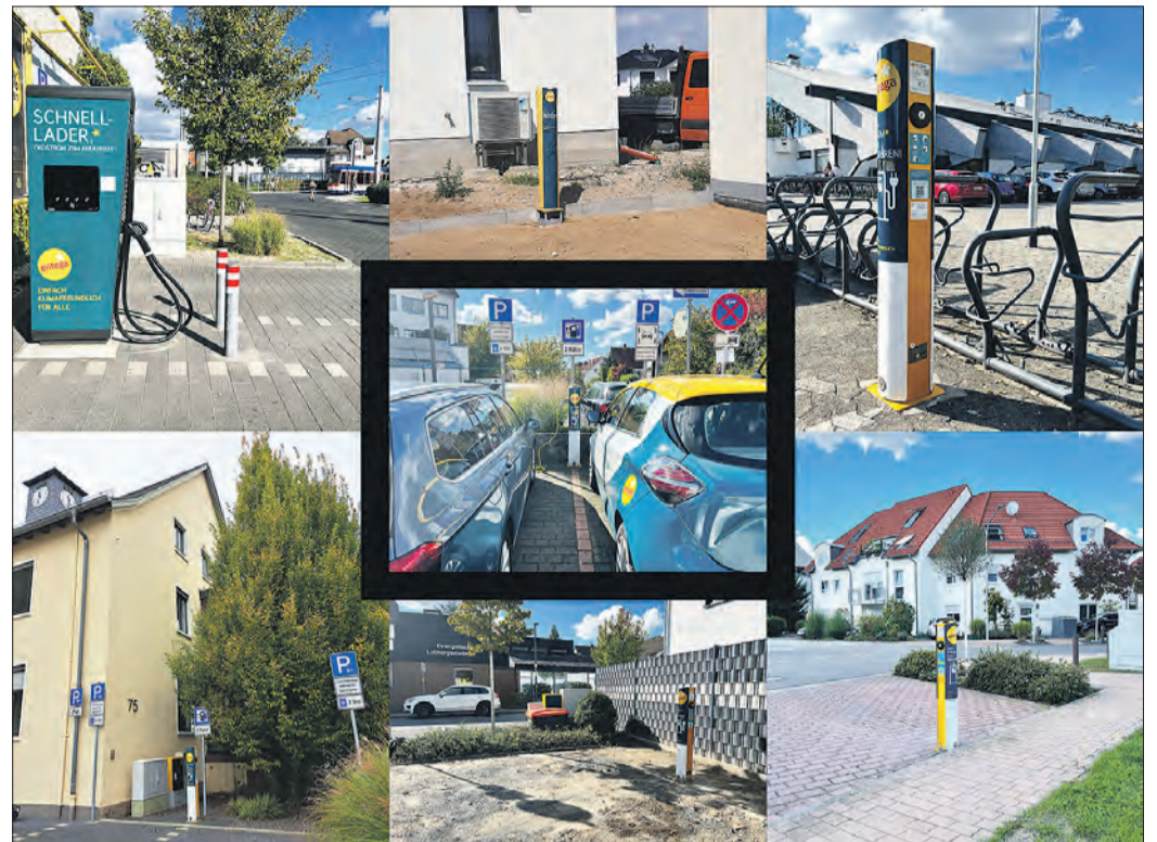
FOTOCOLLAGE mit den Standorten der aktuellen E-Ladesäulen im Stadtgebiet.

Die Normal-Ladesäulen sind ab sofort am Parkplatz Hintergasse / Ecke Pfützenstraße, in der Nelly-Sachs-Straße / Ecke Käthe-Kollwitz-Straße, am Hallenbad und in der Elbestraße (Höhe Saalestraße) nutzbar. Die Schnell-Ladesäule befindet sich am Platz Bar-le-Duc (nordwestlicher Parkplatz). Damit ergänzen die neuen E-Ladesäulen