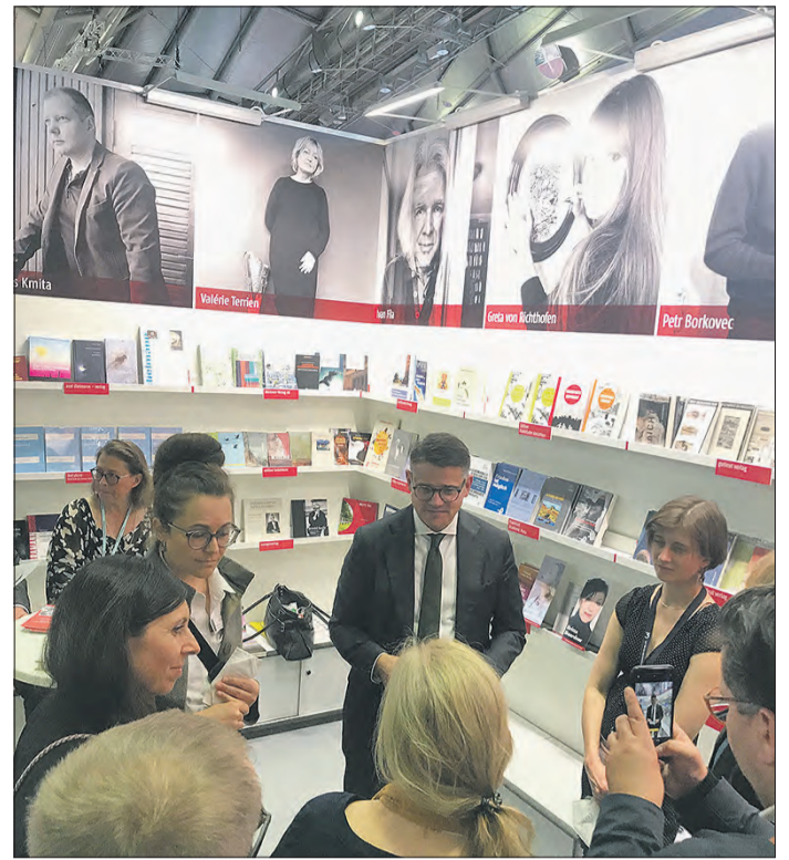
HESSENS MINISTERPRÄSIDENT BORIS RHEIN am Stand der hessischen Verlage.

sen“ auch einen prominenten Politiker zu Gast. Der Hessische Ministerpräsident Boris Rhein unterhielt sich mit verschiedenen Ausstellern und Veranstaltern des Gemeinschaftsstandes. (PR)