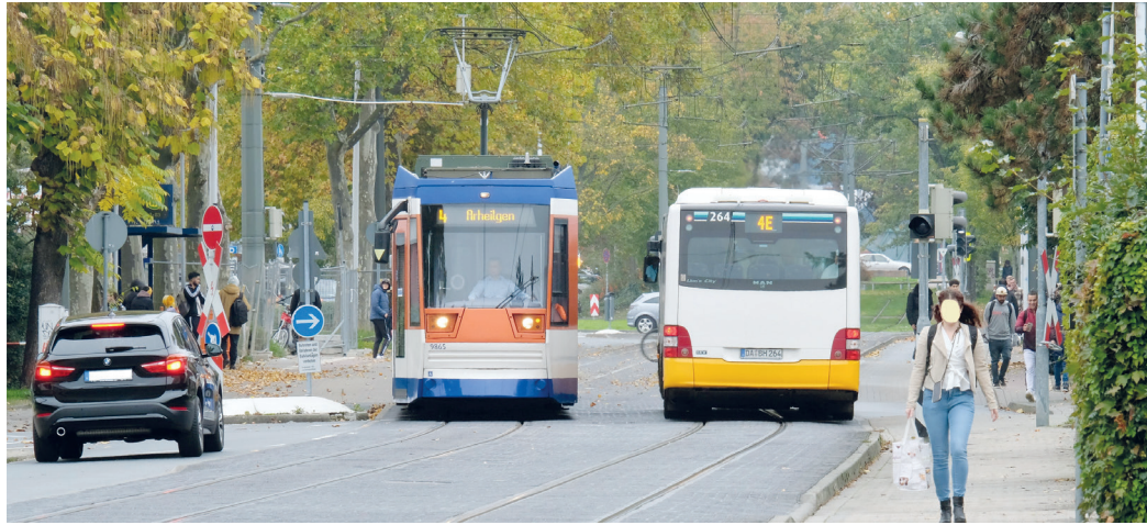
Verloren im Bürgerpark: Ein 4E-Bus kommt, die Schaukelbahn 4 fährt weg. Eine Viertelstunde warten.

AKW-Projektgruppe der IGAB zur vollständigen Streichung des Straßenbahnverkehrs im Darmstädter Norden