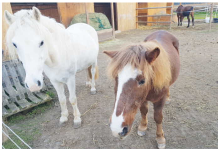
In den Ställen des Reit- und Fahrvereins Arheilgen sind Ponys aller Größen zuhause.

(Arheilgen, SJ) Zu einem Nachmittag mit geführtem Ponyreiten lädt der Reitverein Darmstadt-Arheilgen am Sonntag, 13. November, von 14 bis 17 Uhr, auf seine Anlage an der Steinstraße 41 ein. Auf den kleinen Vierbeinern des Vereins, darunter Shetlandponys und Haflinger, können Kinder ab fünf Jahren das Reiten ausprobieren (gegen Gebühr). Während die Kinder auf den Ponys geführt werden, können Eltern und Geschwisterkinder Kaffee und Kuchen im Reiterstübchen genießen. Eine Anmeldung zum Ponyreiten ist nicht erforderlich.