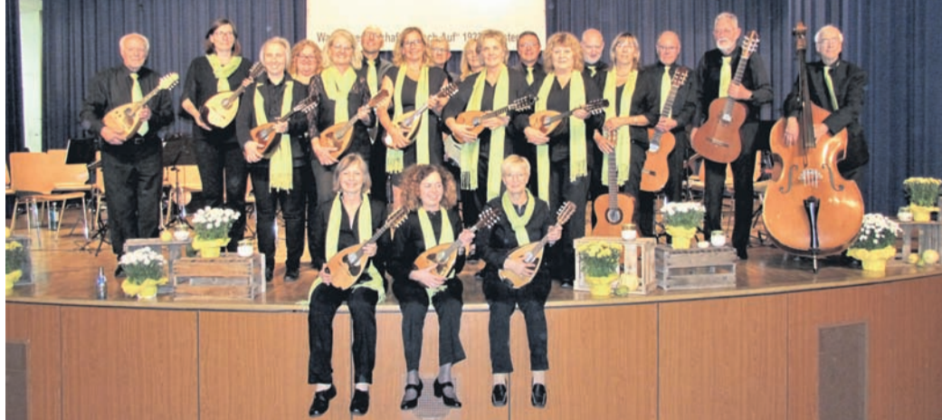
Durch zehn Jahrzehnte führte die musikalische Reise des Mandolinenorchesters.