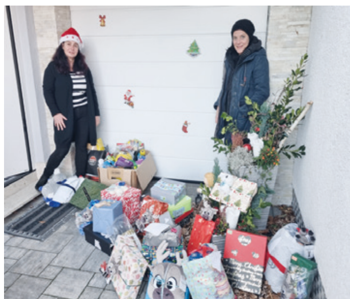
Geschenkübergabe an das Frauenhaus Dieburg.

(KG) Das Weihnachtsfest und damit die feierliche Zeit rückt langsam näher und für die meisten von uns ist es ein Fest der Familie und Geborgenheit. Leider geht es den Kindern und Frauen, die vorübergehend Schutz und Obdach in den Frauenhäusern bzw. in dem Übergangwohnheim Darmstadt gefunden haben, nicht so gut. Sie befinden sich oft in einer extremen Belastungssituation und stehen vor vielen Problemen, die Gewalt die sie erfahren haben zu verarbeiten, aber auch einen Neuanfang in Ihrem Leben zu finden. Persönliche Notsituationen sind besonders tragisch zu Zeiten, an denen die anderen Mitmenschen gemeinsam die festliche Zeit des Jahres einläuten. Um diese schwierigen Lebensumstände wenigstens an Weihnachten für eine kurze Zeit zu vergessen und ein Zeichen des Mitgeföhls zu setzen – starten wir wieder die Weihnachtspäckchenaktion „Weihnachtsengel gesucht“ und hoffen auf Ihre Unterstützung. So konnten wir im letzten Jahr