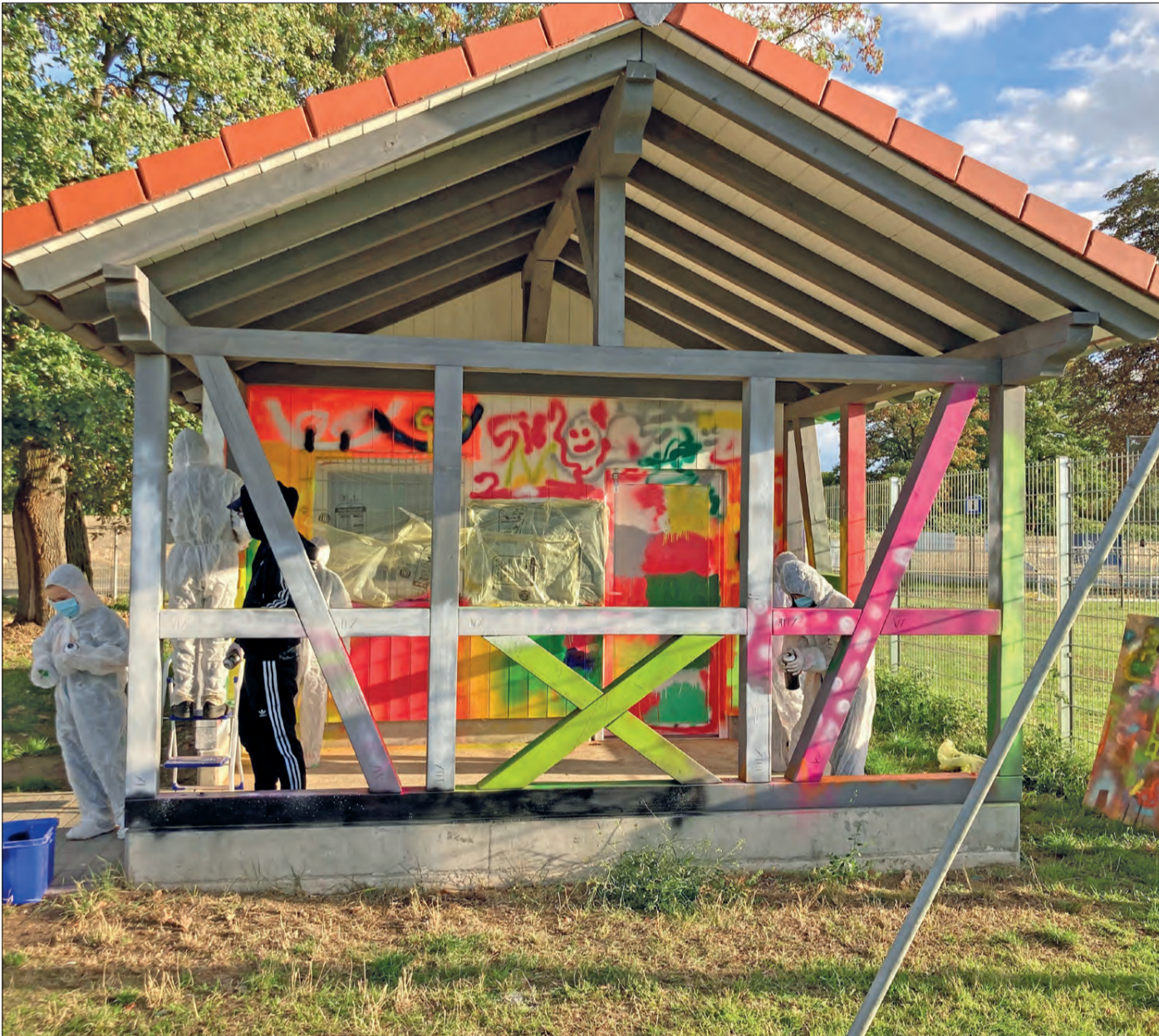
Graffiti-Projekt am Bolzplatz Braunshardt.